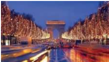
Χριστούγεννα στη Γαλλία

Τα Χριστούγεννα στη Γαλλία αποτελούν την εορταστική κορύφωση του έτους. Σε αντίθεση με άλλες Ευρωπαϊκές χώρες η