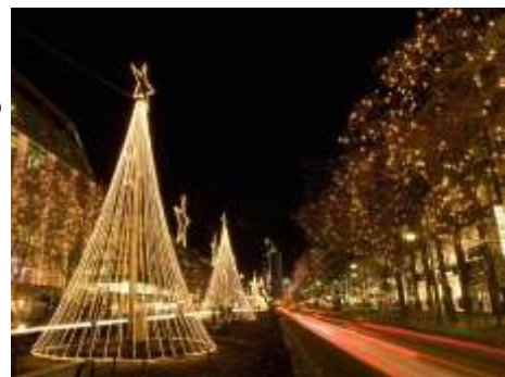
Χριστούγεννα στη Γερμανία

Επίσης, στη Γερμανία συναντάται συχνά το έθιμο του λεγόμενου Adventskranz . Πρόκειται για ένα κηροπήγιο από κλαδιά ελάτου που είναι πλεγμένα έτσι ώστε να σχηματίζουν ένα στεφάνι. Στο στεφάνι απάνω είναι τέσσερις θέσεις με κεριά, που συμβολίζουν τις τέσσερις τελευταίες εβδομάδες πριν τα Χριστούγεννα. Κάθε Κυριακή ανάβουν ένα κεριά παραπάνω, μετρώοντας αντίστροφα το χρόνο που απομένει για τον ερχομό των Χριστουγέννων. Δηλαδή τέσσερις βδομάδες πριν τα Χριστούγεννα ανάβουν ένα