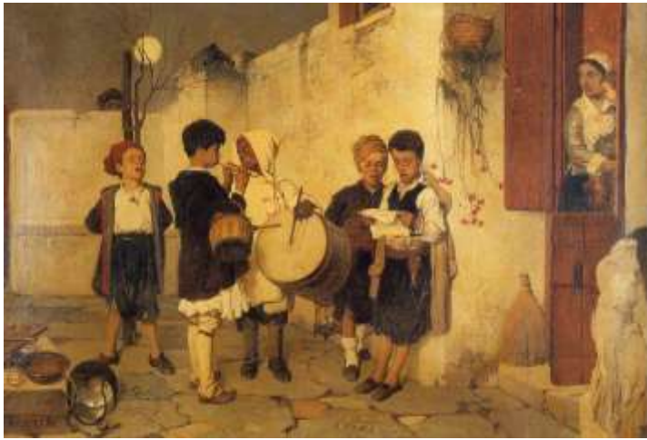
Τα κάλαντα Νικηφόρος Λύτρας (1872)

οι κυράδες. Κυρά ψηλή, κυρά λιγνή, κυρά γαϊτανο- φρύδα, κυρά μου, όταν στολί- ζεσαι να πας στην εκκλησιά σου, βάνεις τον ήλιο πρό- σωπο και το φεγγάρι αγκάλη και τον καθάριο αυγε- ρινό τον βάνεις δα- χτυλίδι. Εμείς εδώ δεν ήρθαμε να φάμε και να πιού- με,