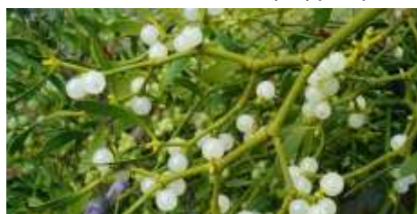
Γκι ή Ιξός

για να διώξει την κακοδαιμονία και να τους φέρει τύχη. Το γκι (ή ιξός, στην ελληνική του ονομασία) μπορεί να πρωταγωνιστεί στο γιορτινό διακοσμητικό σκηνικό, όμως η πιο σημαντική ιδιότητά του παραμένει αφανής. Από τις πρώτες δεκαετίες του περασμένου αιώνα το γκι βρέθηκε