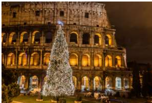
Χριστουγεννιάτικο δέντρο στο Κολοσσαίο της Ρώμης

χωρών. Αρχίζει από τις 8 Δεκεμβρίου και ολοκληρώνεται στις 6 Ιανουαρίου ημέρα των Θεοφανίων. Κατά τη διάρκεια αυτής της περιόδου τα σπίτια διακοσμούνται με Αλεξανδρινά, χριστουγεννιάτικα δένδρα τη παραδοσιακή Φάτνη και άλλα πολύχρωμα διακοσμητικά στολίδια.