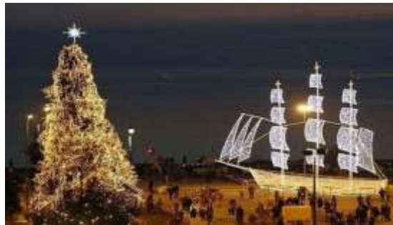
Χριστουγεννιάτικα σύμβολα : Δέντρο και Καράβι

πολλά σπίτια και πλατείες στολίζονται με καράβια προς τιμή του Αγίου Νικολάου, προσάτη των ναυτικών και πρόδρομου του Άγιου Βασίλη, τιμώντας τόσο τον Άγιο όσο και