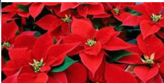
Ποϊνοέτιες ή Αλεξανδρινά

Είναι συνήθως τα πρώτα Χριστουγεννιάτικα λουλούδια που έρχονται στο μυαλό μας, αλλά υπάρχουν πολλά περισσότερα, που μπορούν να εμπλουτίσουν μια γιορτινή διακόσμηση. Χωρίς καμία αμφιβολία είναι τα ομορφότερα και τα διασημότερα