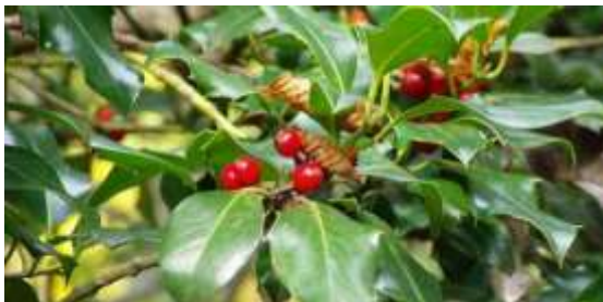
Αρκουδοπούρναρο ή Ου

Λέγεται μάλιστα ότι ένας θάμνος από το φυτό έκρυψε τον Ιωσήφ, τη Μαρία και το Θείο Βρέφος στη φυγή τους προς την Αίγυπτο. Γι' αυτό και η Παναγία το ευλόγησε να είναι πάντα καταπράσινο και να συμβολίζει την αθανασία. Η χρήση του στη σύγχρονη εποχή, σαν στολίδι του σπιτιού, θεωρείται ότι προσελκύει καλοτυχία, ειρήνη και χαρά, συμβολίζοντας την απόλαυση, τον εορτασμό και την ευθυμία.