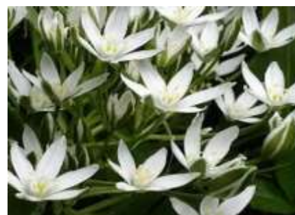
Αστέρι της Βηθλεέμ

ται κυρίως στην περιοχή της Μεσογείου αλλά και στη Βόρεια Αμερική, όπου καλλιεργείται σε κήπους. Ανήκει στην οικογένεια Liliaceae και έχει σκληρά, δύσκαμπτα φύλλα, που μοιάζουν με γρασίδι και μια συστάδα από άσπρα αστεροειδή άνθη που στο πίσω μέρος τους στιγματίζονται με πράσινο χρώμα. Το φυτό αυτό εξαπλώνεται εύκολα όπως τα αγριόχορτα και οι βολβοί του μαγειρεύονταν και χρησιμοποιούνταν