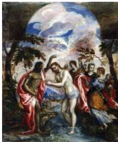
Η βάπτισμα του Χριστού Δομήνικος Θεοτοκόπουλος - (Ελ Γκρέκο)

ράς στον Ιησού και ακούστηκε μια φωνή από τον ουρανό να λέει: