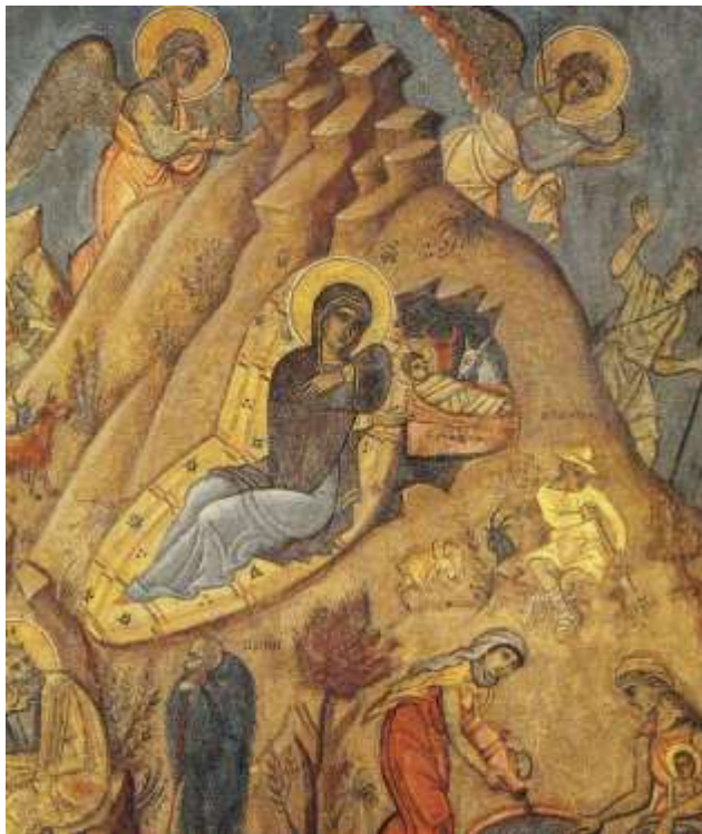
Τοιχογραφία Φ.Κόντογλου, παρεκκλήσιο Οικ.Πεσμαζόγλου Κηφισιά

Η γέννηση του Ιησού ως ανθρώπου παρουσιάζεται ως ένα από τα σημαντικότερα γεγονότα στην Ιστορία όλης της ανθρωπότητας. Η σημαντική και ιδιαίτερη Δεσποτική γιορτή σύμφωνα με το Γρηγόριο Ναζιανζηνό δε θα πρέπει να συγχέεται με τα γενέθλια οποιουδήποτε άλλου ανθρώπου, αφού στα Γενέθλια αυτά εορτάζουμε το μοναδικό και ανεπα-