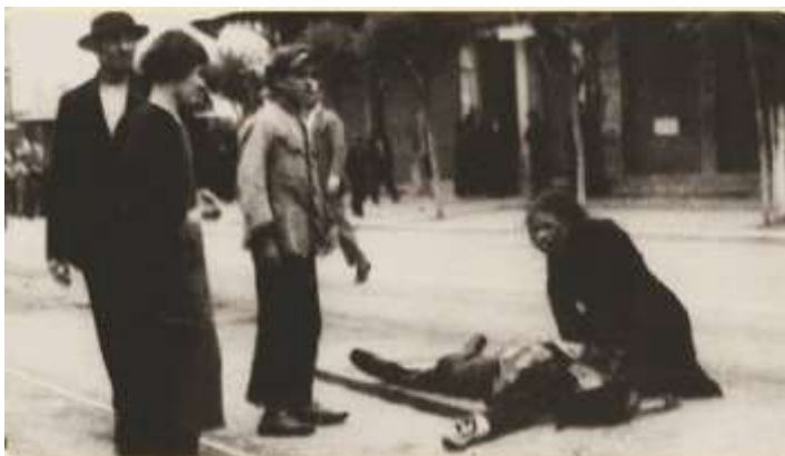
Μάιος 1936 : «Μέρα Μαγιού μου μίσημες, μέρα Μαγιού σε χάνω...»

Στην Ελλάδα, η πρώτη καταγεγραμμένη απεργία έγινε το 1888 στη Δράμα, όταν οι καπνεργάτες απαίτησαν μείωση του ωραρίου εργασί-