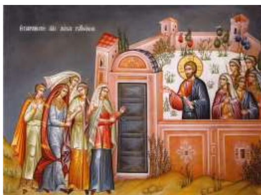
Μεγάλη Τρίτη : Η παραβολή των δέκα παρθένων

Εκτός όμως από την παραβολή των Δέκα Παρθένων στις Ορθόδοξες Εκκλησίες μνημονεύεται σήμερα και η παραβολή των ταλάντων. Σύμφωνα με αυτή, ο Κύριος θέλει να