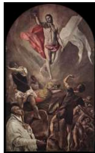
Μεγάλο Σάββατο : Η Ανάσταση

φως εκ του ανεσπέρου φωτός και δοξάσατε Χριστόν τον αναστάντα εκ νεκρών», μεταφέρουν στους