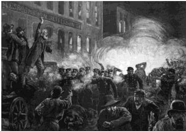
Η συγκέντρωση των εργατών του Σικάγου στην Πλατεία Haymarket (1η Μαΐου 1886)

Στην Ελλάδα, η πρώτη καταγεγραμμένη απεργία έγινε το 1888 στη Δράμα, όταν οι καπνεργάτες απαίτησαν μείωση του ωραρίου εργασί-