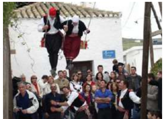
Κύθνος : Η κούνια

Πάσχα. Σύμφωνα με το έθιμο, μια μεγάλη κούνια στήνεται στην κεντρική πλατεία της Χώρας, όπου νέοι και νέες με παραδοσιακές φορεσιές κουνιούνται. Το έθιμο αυτό έχει τις ρίζες του στην αρχαία Ελλάδα και συνδέεται με τον μύθο του Ικάρου και της Ηριγόνης. Σύμφωνα με τον μύθο, ο Ικάριος φιλοξένησε τον θεό Διόνυσο και εκείνος τον δίδαξε πώς να καλλιεργεί αμπέλια και να φτιάχνει κρασί. Αργότερα, ο Ικάριος μέθυσε κατά λάθος κάποιους βοσκούς με το κρασί του και αυτοί, νομίζοντας ότι τους δηλητηρίασε, τον σκότωσαν. Η κόρη του Ικάρου, η Ηριγόνη, βρήκε το πτώμα του πατέρα της και αυτοκτόνησε από τη θλίψη της. Οι Αθηναίοι,