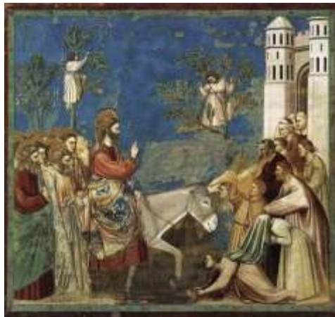
Τζότο, Η είσοδος του Ιησού στα Ιεροσόλυμα

κατά τη διάρκεια της είναι οι πιστοί να λάβουν μέρος στο Θείο Δρά-