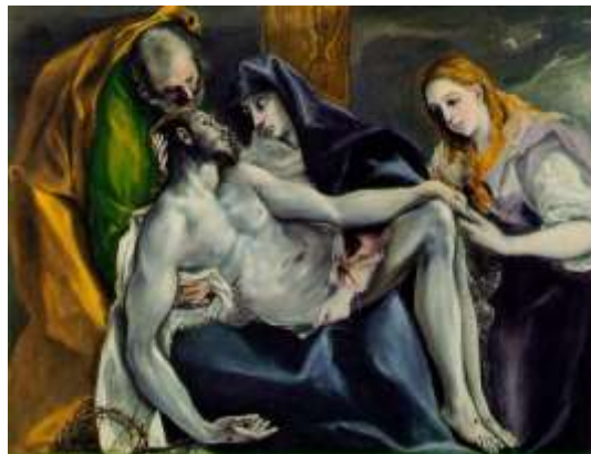
Μεγάλη Παρασκευή : Η Αποκαθήλωση

Το Μεγάλο Σάββατο θυμόμαστε τις Μυροφόρες που αντίκρισαν άδειο τον τάφο του Χριστού και διέδωσαν παντού το νέο. Το πρωί ψάλλεται η λειτουργία