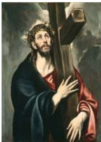
Μεγάλη Πέμπτη : «Σήμερα κρεμάται επί ξύλου...»

Η Πέμπτη της Μεγάλης Εβδομάδας είναι η μέρα κατά την οποία εορτά-