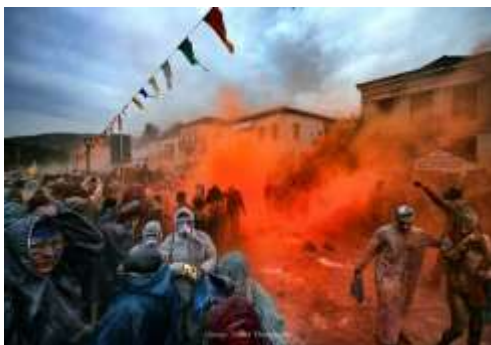
Αλευρομουντζουρώματα στο Γαλαξίδι

Τα αλευρομουντζουρώματα είναι ένα “πρωτότυπο” αποκριάτικο έθιμο που πραγματοποιείται κάθε Καθαρά Δευτέρα στο Γαλαξίδι. Οι συμμετέχοντες “οπλίζονται” με αλεύρι και η πόλη μετατρέπεται σε “εμπόλεμη ζώνη”. Όσοι δεν συμμετέχουν, παρακολουθούν την εκδήλωση στη μια πλευρά του λιμανιού,