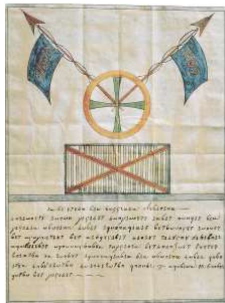
Το σύμβολο της Φιλικής Εταιρείας

Αν οι Έλληνες έπαιρναν την Τριπολιτσά, θα αποδυναμώνονταν τα υπόλοιπα κάστρα και θα είχαν κάνει ένα μεγάλο βήμα για την απελευθέρωση ολόκληρης της Πελο-