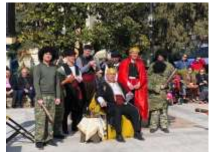
Το έθιμο του Μπέη

Την Ξεκίνησε στη διάρκεια της Τουρκοκρατίας όταν υπήρχαν οι μπέηδες (άρχοντες με μεγάλη περσιούσια και εξουσία). Σατύριζε