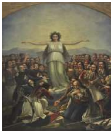
Θεόδωρου Βρυζάκη : Η Ελλάδα ευγνωμονούσα

26/01/1821: Σύσκεψη κληρικών, προεστών και καπεταναίων με τον Παπαφλέσσα και τον Π. Πατρών Γερμανό στο Αίγιο με θέμα την κήρυξη της Επανάστασης.