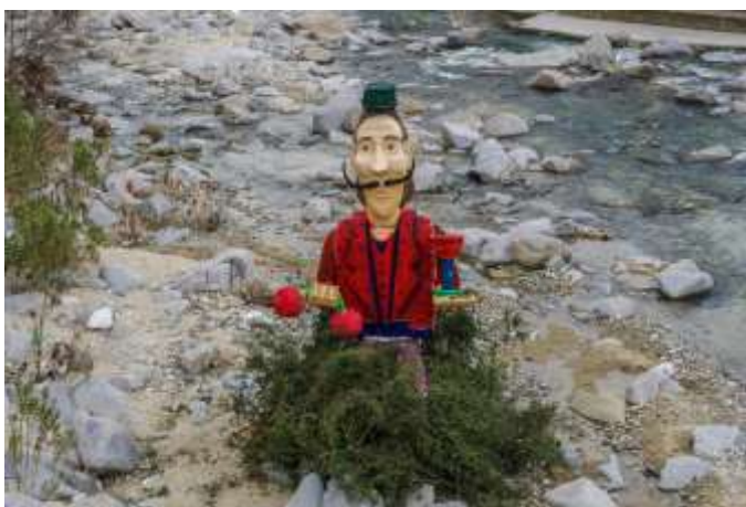
Καρναβάλι στην Ξάνθη σημαίνει το κάψιμο του Τζάρου

ούτε προσευχές. Ο χρόνος της νηστείας για τους πολλούς μετριέται