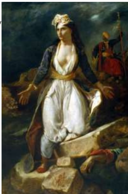
Ευγένιος Ντελακρουά : Η Ελλάδα στα ερείπια του Μεσολογγίου

ες, γέροντες και γυναικόπαιδα, έβαλε φωτιά στην πυριτιδαποθήκη, ενώ ο μητροπολίτης Ρωγών Ιωσήφ ανατίναξε τον Ανεμόμυλο, στην