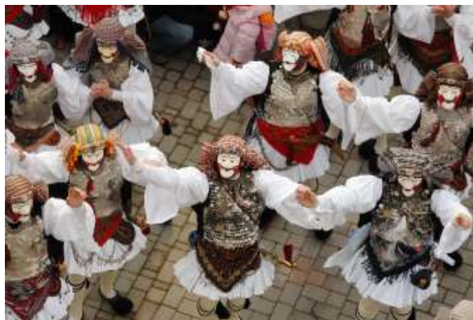
Γενίτσαροι και Μπούλες (Νάουσα)

Αυτό μας έλεγαν οι παππούδες μας. Είχε όμως και το καλό της η νηστεία. Ήταν θέμα υγιεινής. Καθάριζε τον οργανισμό από τις τοξίνες. Αλλά αυτό ίσχυε για τους καλοφαγάδες μόνο. Αργότερα περιορίστηκε η νηστεία σε δυο μόνο βδομάδες. Την πρώτη μέχρι των Αγίων Θεοδώρων, οπότε κοινωνούσαν, και τη Μεγάλη Εβδομάδα προ του Πάσχα. Σήμερα δεν υπάρχει μέτρο. Ισοπεδώθηκαν όλα. Ούτε νηστείες