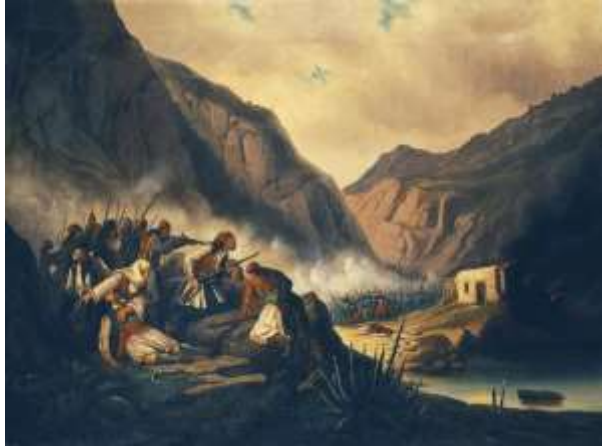
Θεόδωρος Βρυζάκης : Η μάχη των Δερβενακίων

πέρασε τα Μέγαρα και την Κόρινθο και χωρίς αντίσταση έφτασε μέχρι