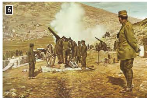
▲ Σκηνή από την πολιορκία των Ιωαννίνων, Ιωάννινα, Χάνι Εμίν Αγά