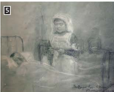
▲ Σκηνή νοσοκομείου, Θεσσαλονίκη 1912, Εθνικό Ιστορικό Μουσείο