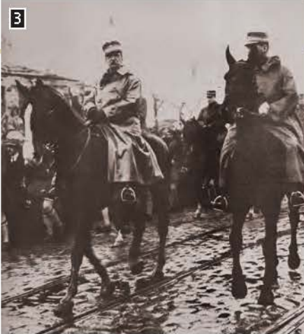
▲ Η είσοδος του βασιλιά Γεώργιου Α' και του διαδόχου Κωνσταντίνου στη Θεσσαλονίκη, Αθήνα, Γεννάδειος Βιβλιοθήκη

▶ Η Ελλάδα και τα Βαλκάνια αμέσως μετά τους Βαλκανικούς Πολέμους