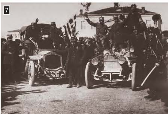
▲ Πανηγυρική είσοδος στρατιωτικών οχημάτων στα Ιωάννινα