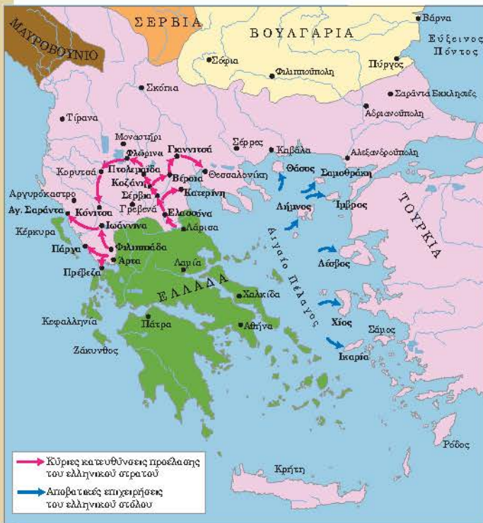
▲ Στρατιωτικές επιχειρήσεις Βαλκανικών Πολέμων

Οι προσδοκίες, που καλλιέργησε στους υπόδουλους χριστιανικούς λαούς το κίνημα των Νεοτούρκων το 1908, γρήγορα διαψεύστηκαν. Παρά τις επίσημες διακηρύξεις για ισότητα όλων των υπηκόων, οι χριστιανικοί πληθυσμοί της Οθωμανικής Αυτοκρατορίας εξακολουθούσαν να υπομένουν διακρίσεις. Μπροστά στις αρνητικές αυτές εξελίξεις, τα βαλκανικά κράτη προχώρησαν σε μυστικές συνεννοήσεις μεταξύ τους, οι οποίες οδήγησαν στους Βαλκανικούς Πολέμους του 1912-1913.