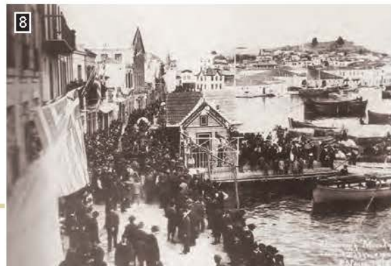
▲ Ο ελληνικός στρατός αποβιβάζεται στη Μυτιλήνη