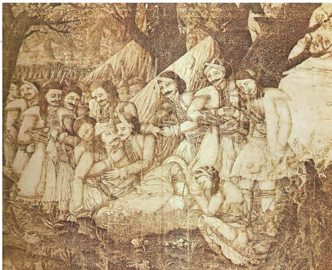
▲ Ο θάνατος του Μάρκου Μπότσαρη, πίνακας του Αθ. Ιατρίδη, Αθήνα, Εθνικό Ιστορικό Μουσείο

Στη διάρκεια του 1823 οι συγκρούσεις των Ελλήνων επαναστατών με τον οθωμανικό στρατό γενικεύτηκαν. Στη Στερεά Ελλάδα οι Έλληνες πολιορκήθηκαν από τους Τούρκους στο Μεσολόγγι. Εκεί ξεχώρισε για τη δράση του ο Μάρκος Μπότσαρης, ο οποίος σκοτώθηκε κατά τη διάρκεια νυκτερινής αιφνιδιαστικής επίθεσης που επιχείρησε τον Αύγουστο του 1823.