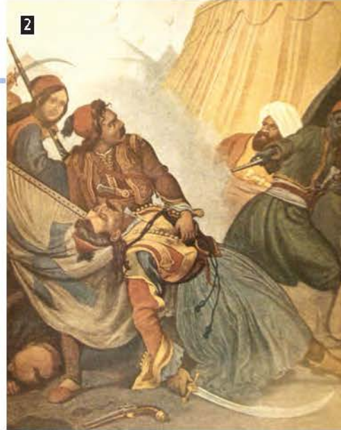
▶ Ο θάνατος του Μάρκου Μπότσαρη, λιθογραφία του Πέτερ φον Es