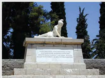
Ο τάφος του Μάρκου Μπότσαρη στον «Κήπο των Ηρώων» στο Μεσολόγγι.

Ο ηρωισμός και η ανιδιοτέλεια του Μάρκου Μπότσαρη συγκίνησαν πολλούς Φιλέλληνες. Ο αμερικανός ποιητής Fitz - Greene Halleck για να τον τιμήσει έγραψε στα αγγλικά το ποίημα με τίτλο «Marco Bozzaris», ενώ ανάλογο ποίημα του αφιέρωσε και ο Ελβετός ποιητής Just Olivier. Επίσης, ο Επτανήσιος μουσικοσυνθέτης Παύλος Καρρέρ έγραψε το 1858 την όπερα «Μάρκος Μπότσαρης».