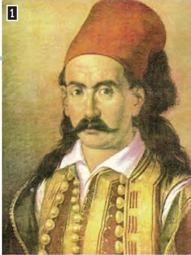
▲ Ο Μάρκος Μπότσαρης