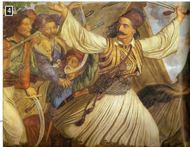
▲ Ο Μπότσαρης επιτίθεται στο στρατόπεδο των Τούρκων, λεπτομέρεια, Αίθουσα των Τροπαίων, Βουλή των Ελλήνων