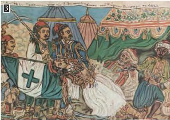
▲ Ο θάνατος του Μάρκου Μπότσαρη, πίνακας του λαϊκού ζωγράφου Θεόφιλου