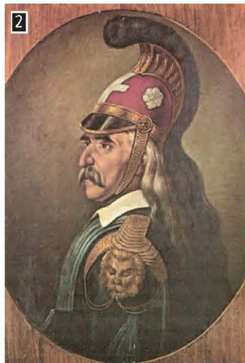
▲ Ο Θεόδωρος Κολοκοτρώνης