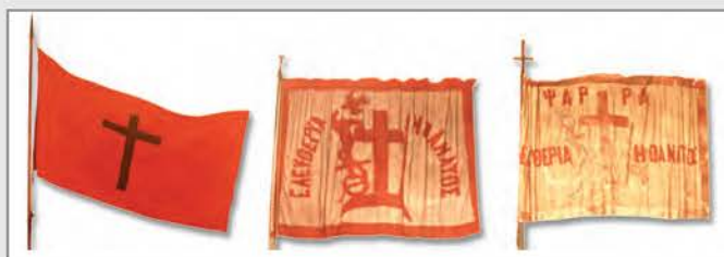
Η πρώτη ελληνική επαναστατική σημαία (αριστερά), πολεμική σημαία των Σπετσών (μέση), πολεμική σημαία των Φαρών (δεξιά)

Στη διάρκεια της Επανάστασης του 1821 δεν χρησιμοποιήθηκε ένα είδος σημαίας. Αντίθετα, κάθε καπετάνιος και κάθε περιοχή συνήθιζαν να έχουν τη δική τους σημαία. Σ' αυτές δέσποζε κατά κανόνα το σημείο του Σταυρού καθώς και το σύνθημα «Ελευθερία ή Θάνατος». Η σημερινή ελληνική σημαία καθιερώθηκε το 1822 από το Σύνταγμα της Επιδάου, έχοντας βεβαίως υλοστεί με το πέρασμα του χρόνου ορισμένες τροποποιήσεις, λόγω των συνταγματικών αλλαγών στο πολίτευμα της χώρας.