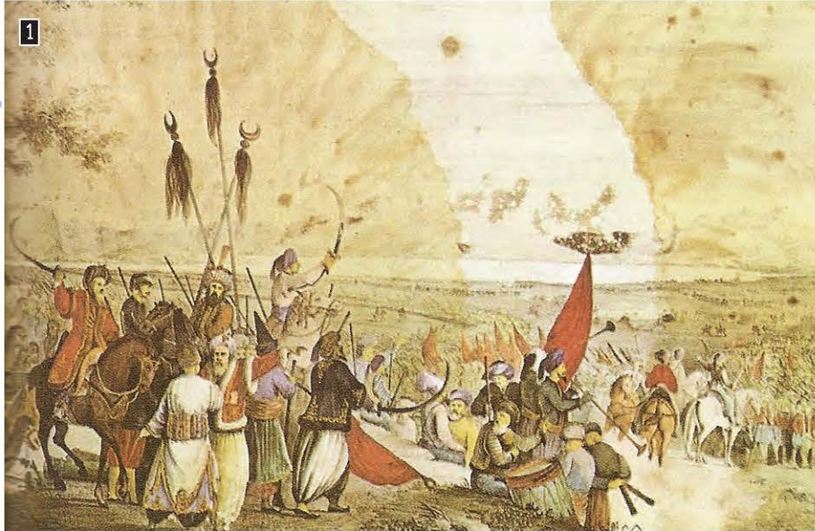
▲ Αλέξανδρος Ησαΐας, Η εκστρατεία του Δράμαλη στην πεδιάδα του Άργους, Αθήνα, Εθνικό Ιστορικό Μουσείο