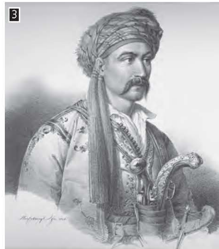
▲ Ο Νικηταράς