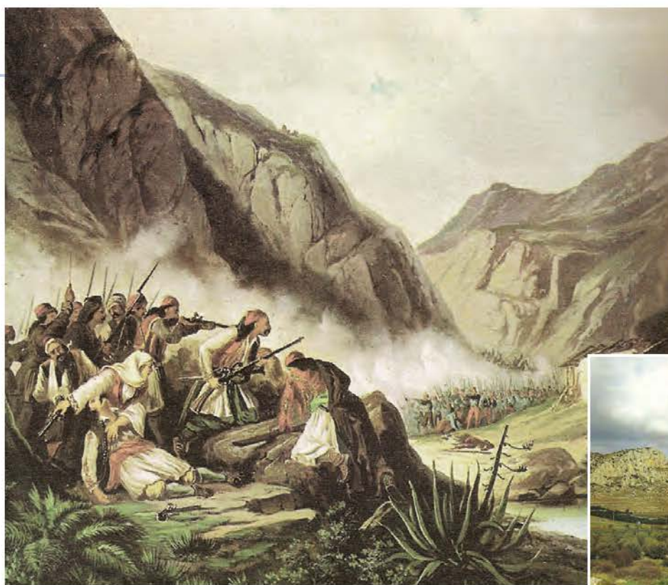
▲ Θεόδωρος Βρυζάκης, Η μάχη στα Δερβενάκια

Οι αρχικές επιτυχίες των Ελλήνων επαναστατών θορύβησαν την Υψηλή Πύλη. Την άνοιξη του 1822 στάλθηκε στη Στερεά Ελλάδα, επικεφαλής πολυάριθμης στρατιωτικής δύναμης, ο Δράμαλης με σκοπό να καταστείλει την Επανάσταση. Παγιδεύτηκε όμως και γνώρισε βαριά ήττα στα Δερβενάκια, στις 26 Ιουλίου του 1822.