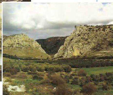
▲ Τα Δερβενάκια σήμερα