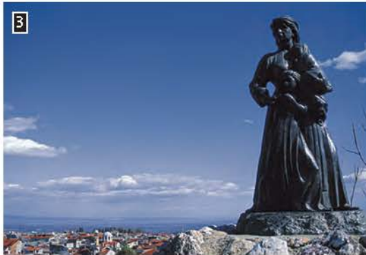
◀ Φωτογραφία του αγάλματος προς τιμήν των γυναϊκόπαιδων της Νάουσας που έχασαν τη ζωή τους το 1822

▶ Η Επανάσταση στις άλλες εστίες του Ελληνισμού