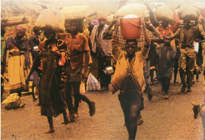
Νεαροί Αφρικανοί Πρόσφυγες: Χτίζοντας το μέλλον, Ύπατη Αρμοστεία του ΟΗΕ για τους Πρόσφυγες

6. Και στις μέρες μας όμως δεν είναι λίγες οι περιπτώσεις λαών που εξαναγκάζονται να εγκαταλείψουν τον τόπο τους και τα σπίτια τους. Στις φωτογραφίες βλέπετε πρόσφυγες από την Αφρική που προσπαθούν να ξεφύγουν από την πείνα και τον πόλεμο. Περιγράψτε στους συμμαθητές σας τις φωτογραφίες και μιλήστε για τα συναισθήματα που σας δημιουργούν.