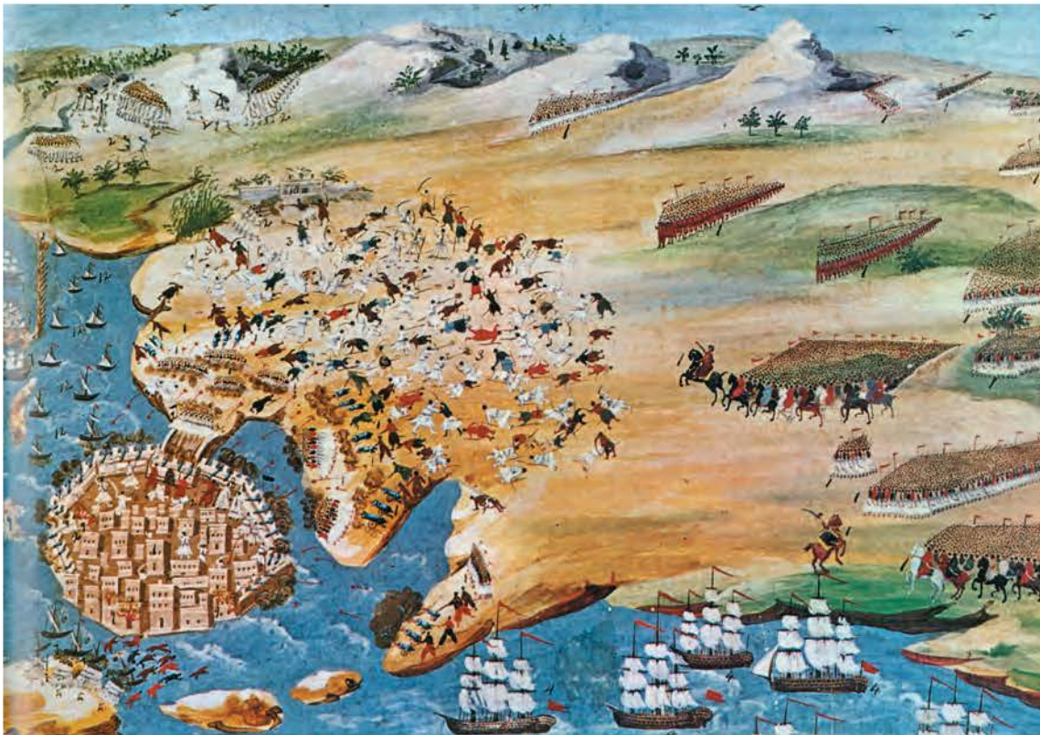
σύνθεση των Δ. Ζωγράφου - Ι. Μακρυγιάννη

«Πολλοί τα κατάφεραν τελικά και γλίτωσαν. Μα δεν τους ένοιαζε αυτό! Σημασία δεν είχε η ζωή τους, ήθελαν μόνο να είναι ελεύθεροι! Γι' αυτό, όσοι απόμειναν στο Μεσολόγγι μαζεύτηκαν στο σπίτι του γέροντα Καψάλη, κι όταν οι Τούρκοι τους περικύκλωσαν, έβαλαν φωτιά στα βαρέλια με το μπαρούτι κι έγινε ολοκαύτωμα!»