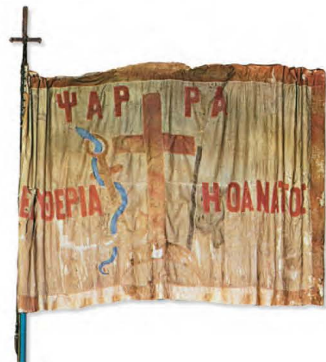
Ψαρά - Σημαία - Επανάσταση 1821

3. Χωριστείτε σε ομάδες και συγκεντρώστε φωτογραφίες, από εγκυκλοπαίδειες, ιστορικά βιβλία και μουσεία με τα εμβλήματα, τα λάβαρα, τις στολές και τις σημαίες της Ελληνικής Επανάστασης. Γράψτε τη χρονολογία κάτω από κάθε φωτογραφία και δώστε χρήσιμες ιστορικές πληροφορίες . Στο τέλος, φτιάξτε με το υλικό σας το βιβλίο της 25ης Μαρτίου και παρουσιάστε το και στις άλλες τάξεις.