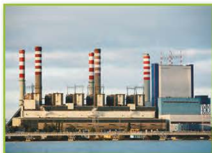
παραγωγή ηλεκτρικής ενέργειας