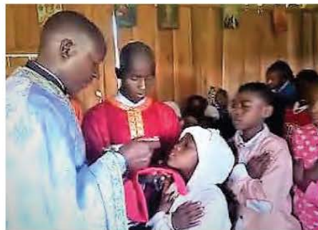
Η ιερή στιγμή της Θείας Μετάληψης στον ι. ναός Ευαγγελισμού της Θεοτόκου, Σάγανα Κένυας

Στην Κένυα , το έργο αγάπης της ορθόδοξης ιεραποστολής κάνει έντονη την παρουσία του. Προσφέρονται φάρμακα, τρόφιμα και κάθε δυνατή φροντίδα στους ταλαιπωρημένους ανθρώπους. Κτίστηκαν νηπιαγωγεία, σχολεία, Πολυτεχνική σχολή στην περιοχή των Μασαί,