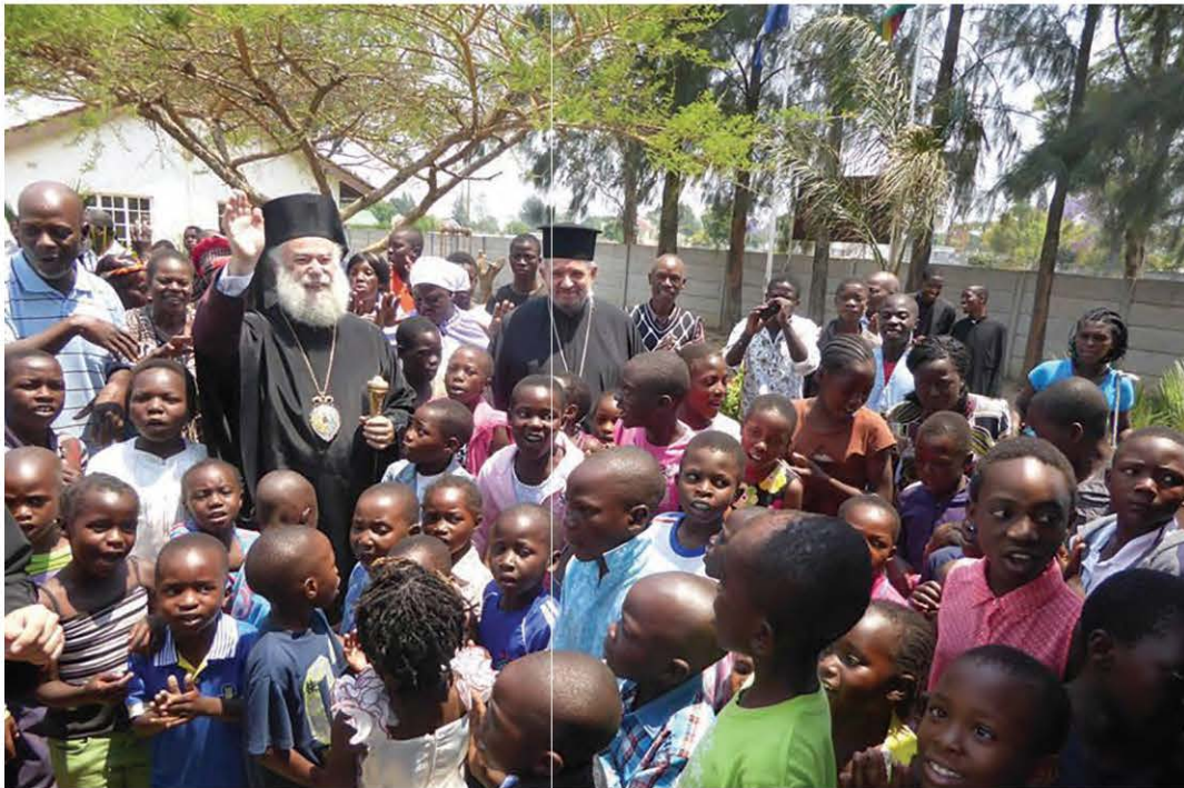
Ιεραποστολή στην Αφρική (Ζιμπάμπουε)