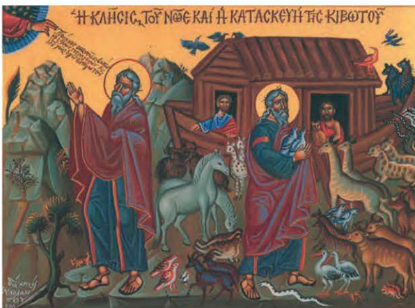
Η κλήση του Νώε και η κατασκευή της κιβωτού. Σχέδιο Γ. Νικολακόπουλου

Οι άνθρωποι, όμως, που είχαν σωθεί με θεία παρέμβαση, ξέφυγαν και πάλι από τον δρόμο του Θεού και έτσι το κακό δεν άργησε να ξαναγυρίσει στον κόσμο. Ο Θεός θέλησε να συμπαρασταθεί για άλλη μια φορά στους ανθρώπους, δίνοντάς τους Νόμο, που θα τους βοηθούσε να φτιάξουν έναν δίκαιο κόσμο. Έτσι, έδωσε στον Μωυσή τις Δέκα Εντολές, κάνοντας μια Διαθήκη (συμφωνία) μαζί του. Οι Εντολές αυτές έπρεπε να φυλαχτούν καλά και να δοθούν και στις επόμενες γενιές ως μια κληρονομιά αλήθειας, που θα προφύλασσε τον κόσμο από την εξάπλωση της αμαρτίας και τις επιπτώσεις της. Ο Μωυσής τις χάραξε πάνω σε δύο πέτρινες πλάκες και τις έβαλε σε ένα ξύλινο κιβώτιο, το οποίο έμοιαζε με την κιβωτό του Νώε. Αυτή ήταν η Κιβωτός της Διαθήκης, που αργότερα φυλασσόταν στον ναό του Σολομώντα.