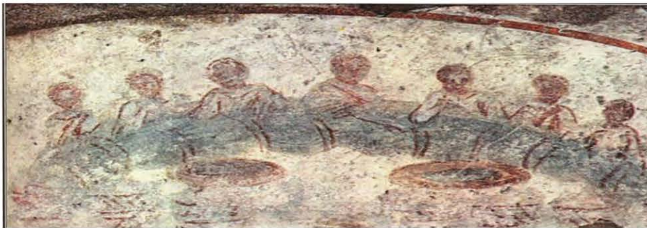
Δείπνο αγάπης (κατακόμβη αγ. Καλλίστου, Ρώμη)

Όλα αυτά είχαν ως αποτέλεσμα να σχετίζονται μεταξύ τους οι πιστοί με ειλικρινή αγάπη. Οι διαφορές, οι εγωισμοί, τα μίσση είχαν δώσει τη θέση τους στην ταπεινωση και την αδελφική αγάπη. Σαν μια οικογένεια, κάθονταν όλοι μαζί στο ίδιο τραπέζι κι έτρωγαν χωρίς να ξεχωρίζουν κανένα για τον πλούτο του, την κοινωνική του θέση και τη μόρφωσή του. Τα κοινά αυτά τραπέζια, στα οποία έπαιρναν μέρος οι πρώτοι χριστιανοί και στα οποία όλοι πρόσφεραν χρήματα για την ετοιμασία τους, ονομάζονταν Αγάπες.