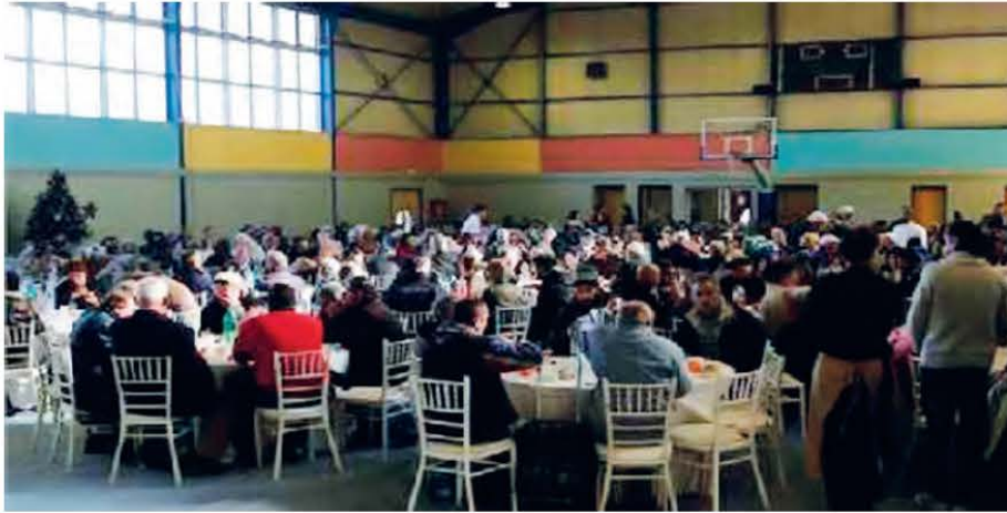
Γεύματα αγάπης – Χριστούγεννα 2015