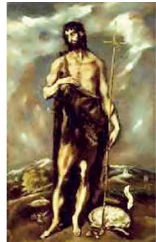
Άγιος Ιωάννης ο Βαπτιστής, Δομίνικος Θεοτοκόπουλος. Μουσείο Τέχνης, Καταλονία, Βαρκελώνη