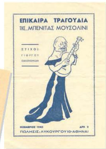
Προγράμματα Επιθεώρησης και φυλλάδιο με σατιρικά* τραγούδια

Στις 28 Οκτωβρίου του 1940 η πατρίδα μας μπήκε στη δίνη του Δεύτερου Παγκόσμιου πολέμου. Η σύγκρουση με τις δυνάμεις του Άξονα* ήταν σκληρή. Σ' όλη τη διάρκεια του μεγάλου αγώνα, οι Έλληνες στρατιώτες είχαν συμπαραστάτες, εκτός από τον απλό λαό, συγγραφείς, καλλιτέχνες, ηθοποιούς, τραγουδιστές και συνθέτες.