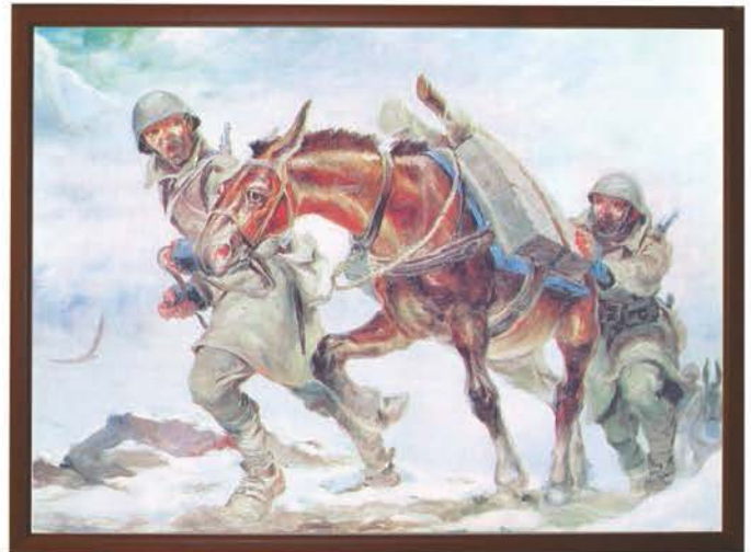
Αλέξανδρος Αλεξανδράκης, «Άγνωστοι Ήρωες»

Ο ποιητής Οδυσσέας Ελύτης πολέμησε στο Αλβανικό Μέτωπο. Τη συγκλονιστική εμπειρία που έζησε στα χιονισμένα βουνά την περιγράφει στην «Πορεία προς το μέτωπο», ανάγνωσμα από το ποιητικό έργο « Άξιον Εστί », που έχει μελοποιήσει ο συνθέτης Μίκης Θεοδωράκης .