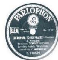
Ετικέτα Δίσκου γραμμοφώνου 78 στροφών

Άκουσε το τραγούδι « Ντούτσε - Ντούτσε »* από τον τραγουδιστή της εποχής Νίκο Γούναρη (βλέπε ανθολόγιο του βιβλίου σου). Τη μουσική έγραψε ο Θεόφραστος Σακελλαρίδης και τους στίχους ο Γιώργος Οικονομίδης .