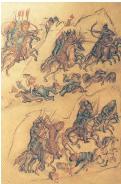
2. Η διπλωματία «των ξένων όπλων»: Το ιππικό των Ρώσων κυνηγά τους Βούλγαρους. Η εικόνα αναφέρεται στην περίοδο που οι Ρώσοι συνεργάστηκαν με τους Βυζαντινούς εναντίον των Βουλγάρων (δες κεφάλαιο 22). (Μικρογραφία από βουλγαρικό χειρόγραφο, Βιβλιοθήκη Βατικανού)