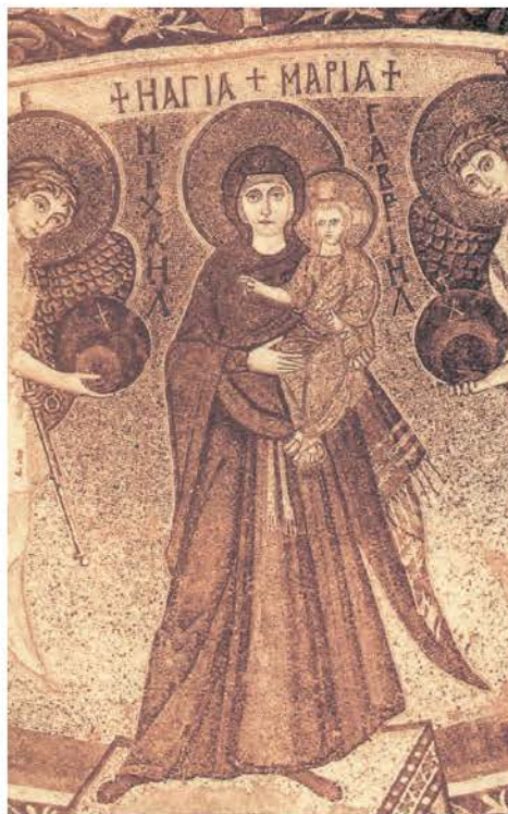
3. Ψηφιδωτή εικόνα, από την Παναγία την Αγγελόκτιστη, στο Κίτιο της Κύπρου.

Ιστορία του Ελληνικού Έθνους (Εκδοτική Αθηνών)