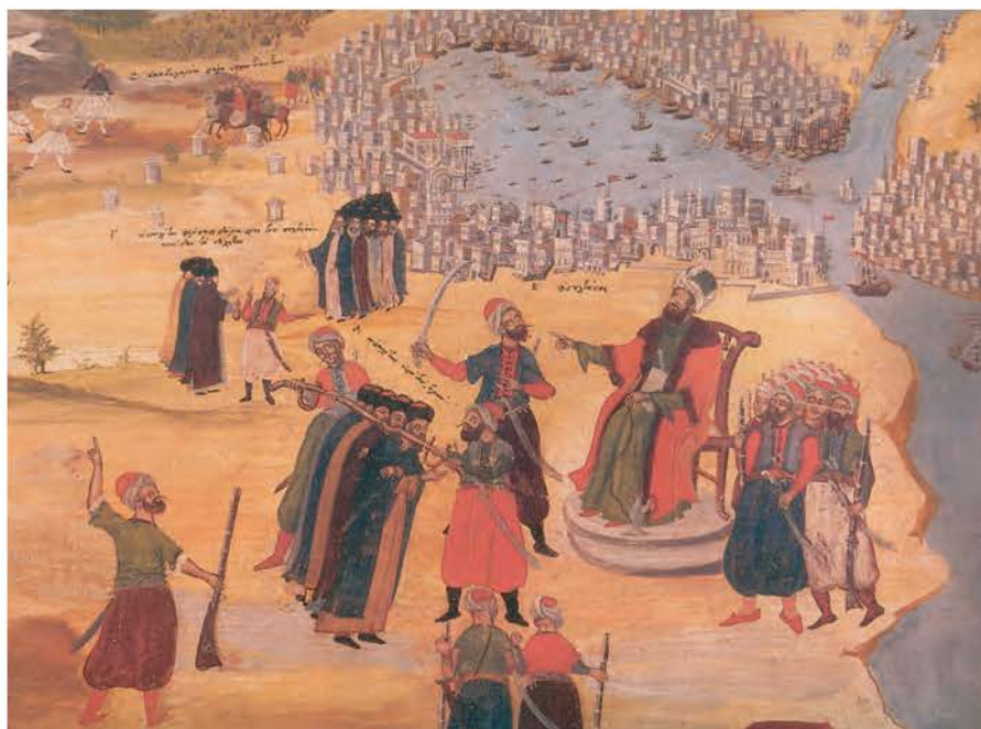
2. Η πολιορκία της Κωνσταντινουπόλης. (Σκέψις Μακρυγιάννη, πίνακας Π. Ζωγράφου, 1836)

Στις 20 Απριλίου, ξημερώματα, οι ελπίδες των αποκλεισμένων ζωντανεύουν. Τρία μεγάλα γενοβέζικα καράβια και μια βυζαντινή φορτηγίδα με κυβερνήτη τον Φλαντανελά, περνούν απαρατήρητα τα στενά, φτάνουν στην Προποντίδα και κατευθύνονται στον Κεράτιο, φορτωμένα σπάρη, εφόδια και πολεμιστές. Οι Τούρκοι ξαφνιάζονται και ρίχνονται πάνω τους να τα προλάβουν πριν περάσουν την αλυσίδα. Στη σκληρή ναυμαχία που ακολούθησε, τα χριστιανικά καράβια νίκησαν και μπήκαν στον ελεύθερο ακόμη Κεράτιο. Το γεγονός αυτό εμπύχωσε τους πολιορκημένους, που δέχτηκαν σαν ήρωες τους νικητές. Εξόργισε όμως τον Μωάμεθ, που τιμώρησε σκληρά τον ναύαρχό του και πήρε νέα μέτρα, πιο σκληρά, για την πολιορκία και την άλωση της Πόλης.