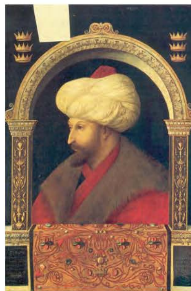
1. Ο Μωάμεθ Β΄.

Την αρνητική απάντηση ακολούθησε καταιγίδα κανονιοβολισμών. Οι πολιορκητές ξεχύνονται προς τα τείχη. Στήνουν ξύλινους πύργους, σκάβουν λαγούμια 2 κάτω από τα