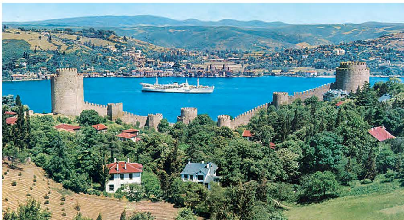
6. Ο Μωάμεθ έχτισε στον Βόσπορο ένα φρούριο, το Ρούμελη Χισάρ, για να ελέγχει τα πλοία που πήγαιναν προς την Κωνσταντινούπολη.

Δούκας (ιστορικός της Άλωσης) (ελεύθερη απόδοση, Ν. Καζαντζάκης).