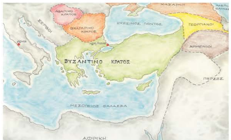
1. Χάρτης της αυτοκρατορίας στα χρόνια των Μακεδόνων.