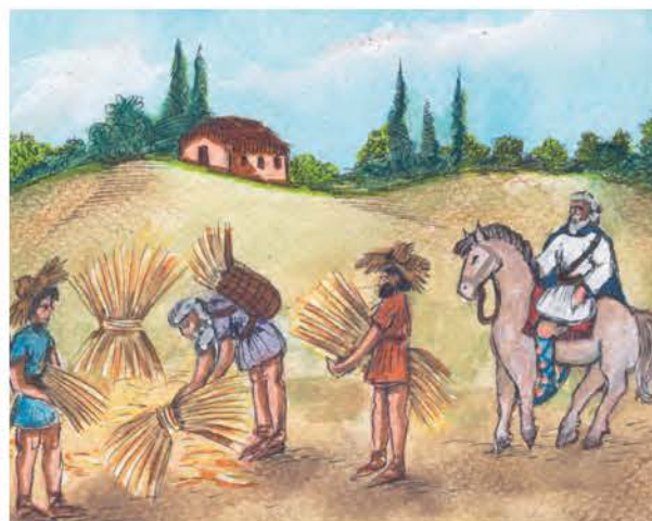
3. Δυνατός μεγαλοκτηματίας επιβλέπει τον θερισμό των κτημάτων του.

Κωνσταντίνος Πορφυρογέννητος, Νεαρά (Μάρτιος 947 μ.Χ.)