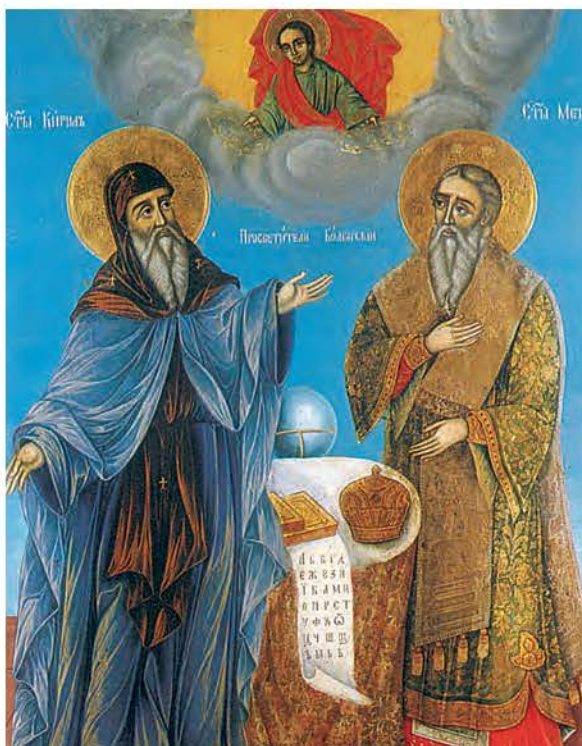
2.α. Οι ἅγιοι Κύριλλος και Μεθόδιος.

Ο Κύριλλος και ο Μεθόδιος ήταν γιοι σεβαστής οικογένειας, που ζούσε στη Θεσσαλονίκη. Ο Κύριλλος ήταν μεγαλύτερος και γεννήθηκε γύρω στα 822 μ.Χ. και τον ονόμασαν Κωνσταντίνο. Και οι δύο