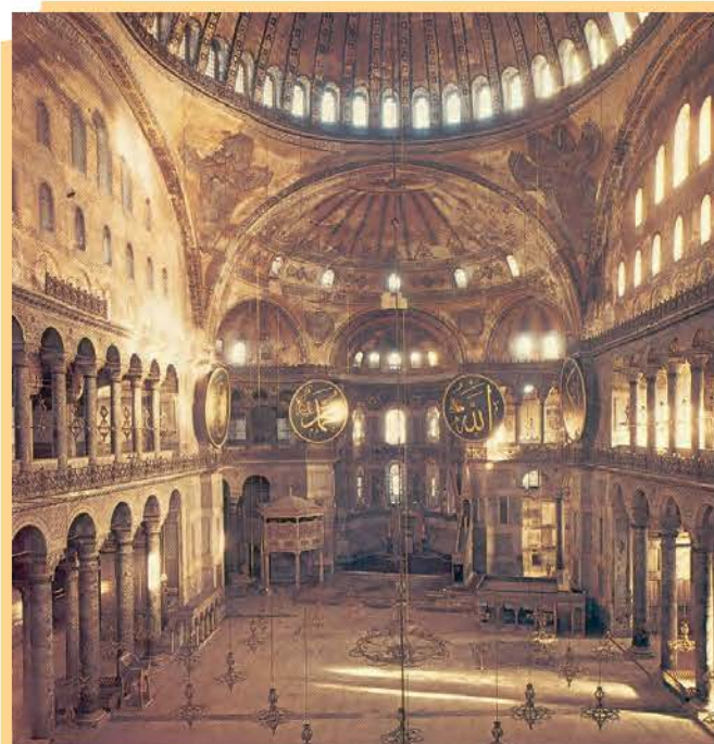
3.α. Το εσωτερικό της Αγίας Σοφίας, όπως σώζεται σήμερα.

2. Η Αγία Σοφία, μετά την άλωση της Πόλης από τους Τούρκους, έγινε τζαμί και σήμερα λειτουργεί ως μουσείο.