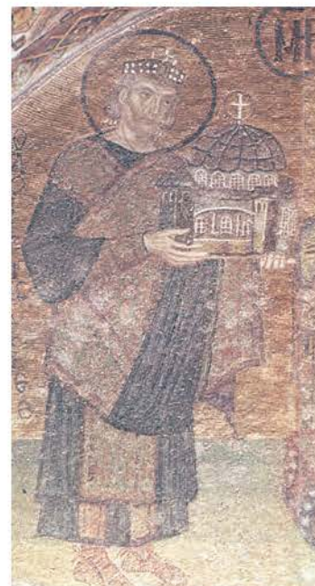
1 .Ο Ιουστινιανός προσφέρει την Αγία Σοφία στη Θεοτόκο. (Ψηφιδωτό από τον ναό)