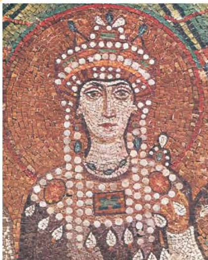
3. Η αυτοκράτειρα Θεοδώρα. (Ψηφιδωτό από τον Άγιο Βιτάλιο, Ραβέννα)