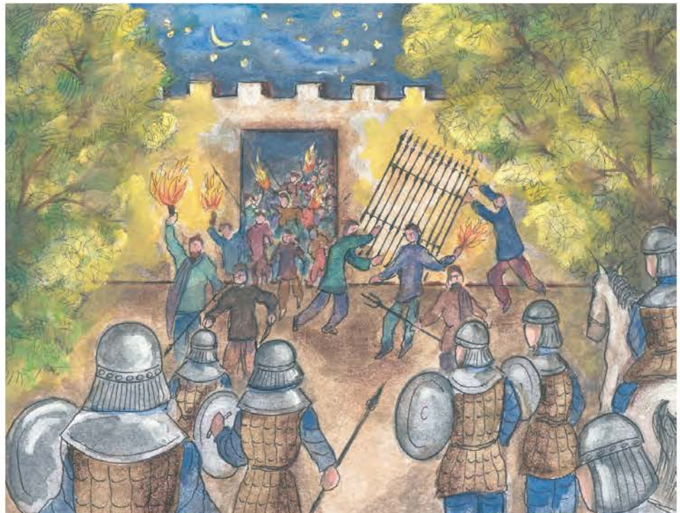
1. Οι στασιαστές, Πράσινοι και Βένετοι, έσπασαν τις πύλες του ιπποδρόμου και ξεχύθηκαν στους δρόμους της Πόλης κραυγάζοντας: «νίκα-νίκα».

Οι ταραχές δεν περιορίστηκαν στον ιππόδρομο. Οι στασιαστές άνοιξαν τις πύλες και ξεχύθηκαν στην Πόλη. Ληλάτησαν την αγορά, πυρπόλησαν δημόσια κτίρια, την Αγία Σοφία και τα προπύλαια του Παλατιού, φωνάζοντας