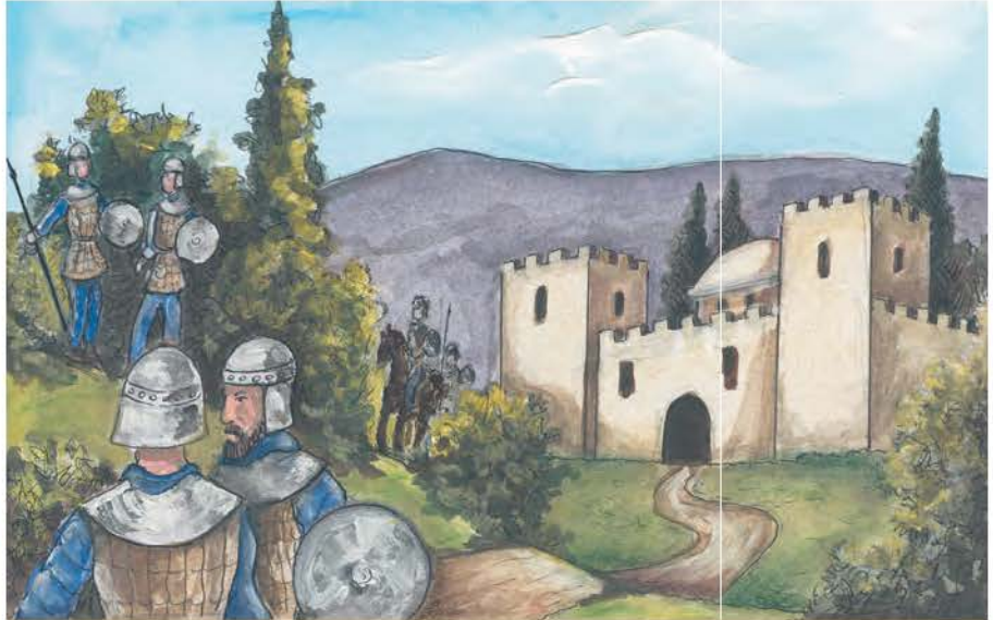
3. Ο εξοπλισμός των στρατιωτών και τα φρούρια των συνόρων έκαναν το κράτος ασφαλέστερο.