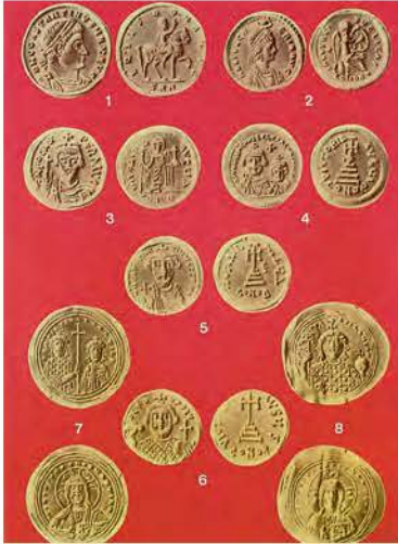
2. Τα χρυσά βυζαντινά νομίσματα ήταν περιζήτητα και έξω από τα σύνορα της αυτοκρατορίας.

Όλα αυτά έκαναν το Βυζάντιο πλούσιο και δυνατό και τον αυτοκράτορα έτοιμο να ζωντανέψει το όνειρό του: να φτάσει τη βυζαντινή αυτοκρατορία στα παλιά σύνορα της ρωμαϊκής.