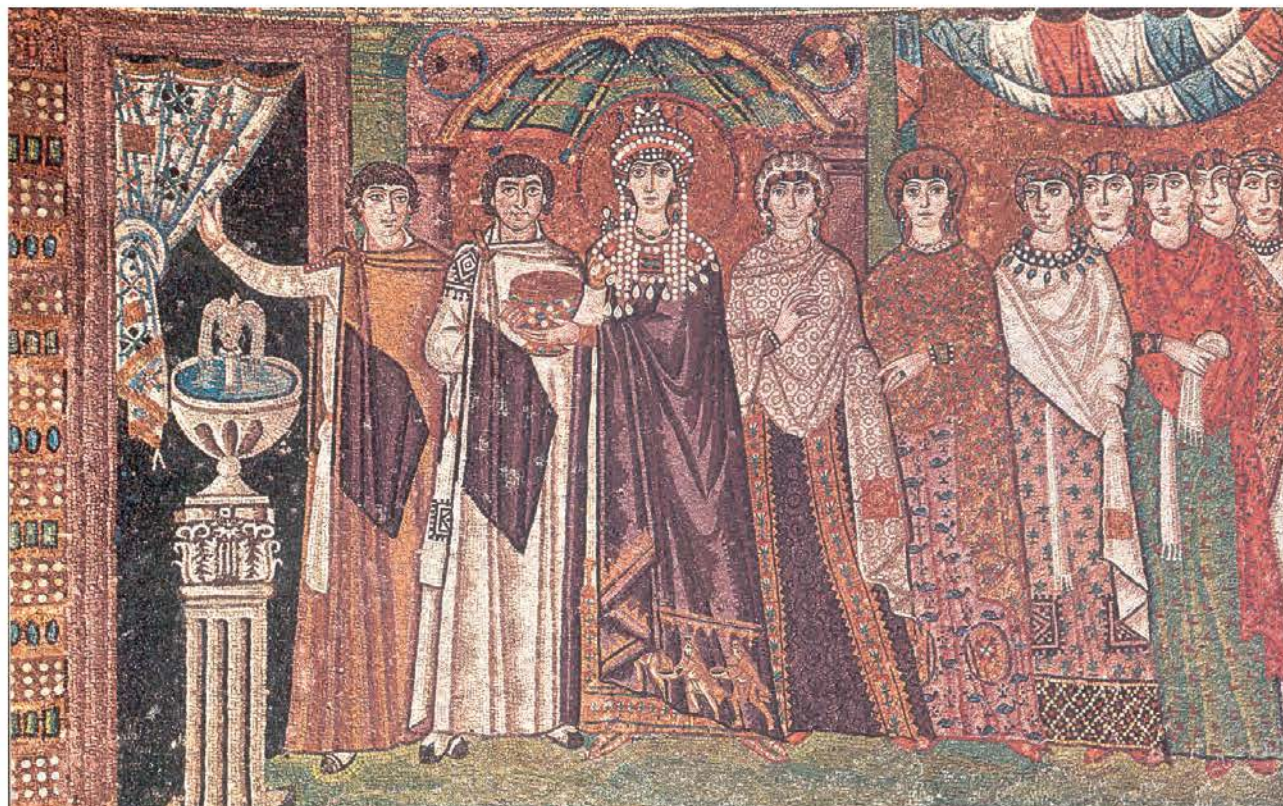
5. Η Θεοδώρα με την ακολουθία της. (Ραβέννα, Άγιος Βιτάλιος)