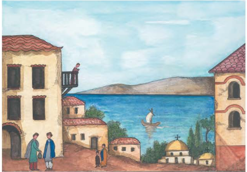
1. Ο Κωνσταντίνος όρισε ότι σε κανένα κτίσμα δεν επιτρεπόταν να εμποδίζει τη θέα των γειτόνων του.

Εκτός από τις σταθερές αγορές υπήρχαν και οι υπαίθριες 2 . Αυτές λειτουργούσαν στο κέντρο και στις λαϊκές συνοικίες της Πόλης, ορισμένες ημέρες της εβδομάδας. Εκεί πουλούσαν τα προϊόντα τους πολλοί παραγωγοί και βιοτέχνες σε καλύτερες τιμές. Γι' αυτό τις επισκεπτόταν πολύς κόσμος. Σ' αυτές σύχναζαν και πλανόδιοι διασκεδαστές.