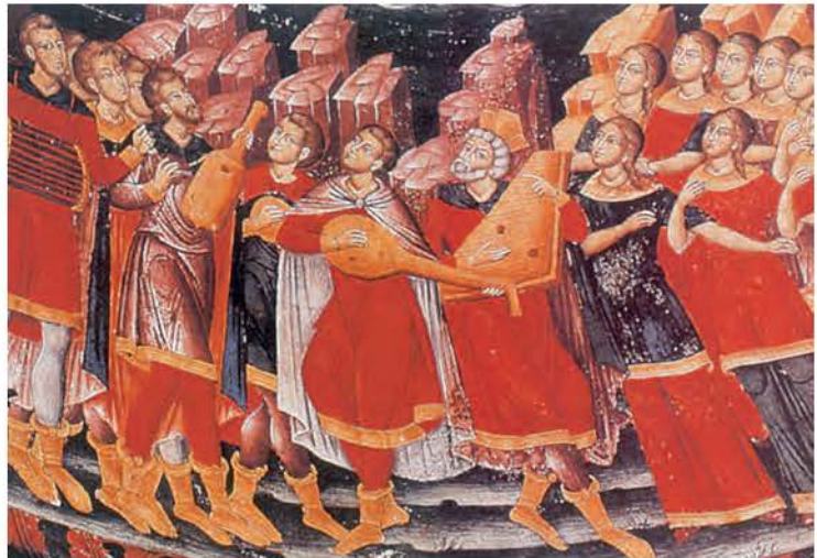
3.1. Και στις θρησκευτικές γιορτές οι Βυζαντινοί χρησιμοποιούσαν διάφορα μουσικά όργανα (Αγιογραφία, Τσεπέλοβο).

Οι Βυζαντινοί είχαν πολλές γιορτές δημόσιες, οικογενειακές και θρησκευτικές. Τιμούσαν ιδιαίτερα τους τοπικούς αγίους και μετείχαν ευχάριστα στις εκδηλώσεις λατρείας τους. Στα πανηγύρια που γίνονταν τη μέρα της γιορτής τους, μετά τη θεία λειτουργία, έτρωγαν, έπιναν, χόρευαν και τραγουδούσαν. Τους άρεσε ιδιαίτερα η μουσική και πολλοί έψελναν, τραγουδούσαν και έπαιζαν μουσικά όργανα.