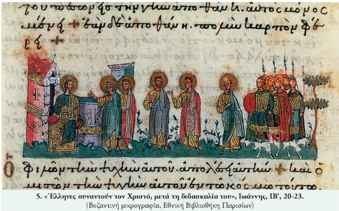
5. «Ἕλληνες συναντοῦν τον Χριστό, μετά τη διδασκαλία του», Ιωάννης, IB', 20-23.

(Βυζαντινή μικρογραφία, Εθνική Βιβλιοθήκη Παρισίων)