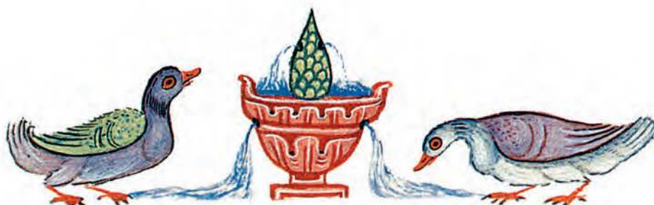
Μοτίβο (διακοσμητικό θέμα) από εικονογράφηση βυζαντινού χειρόγραφου. Σχετικά μοτίβα υπάρχουν και σε επόμενα κεφάλαια.