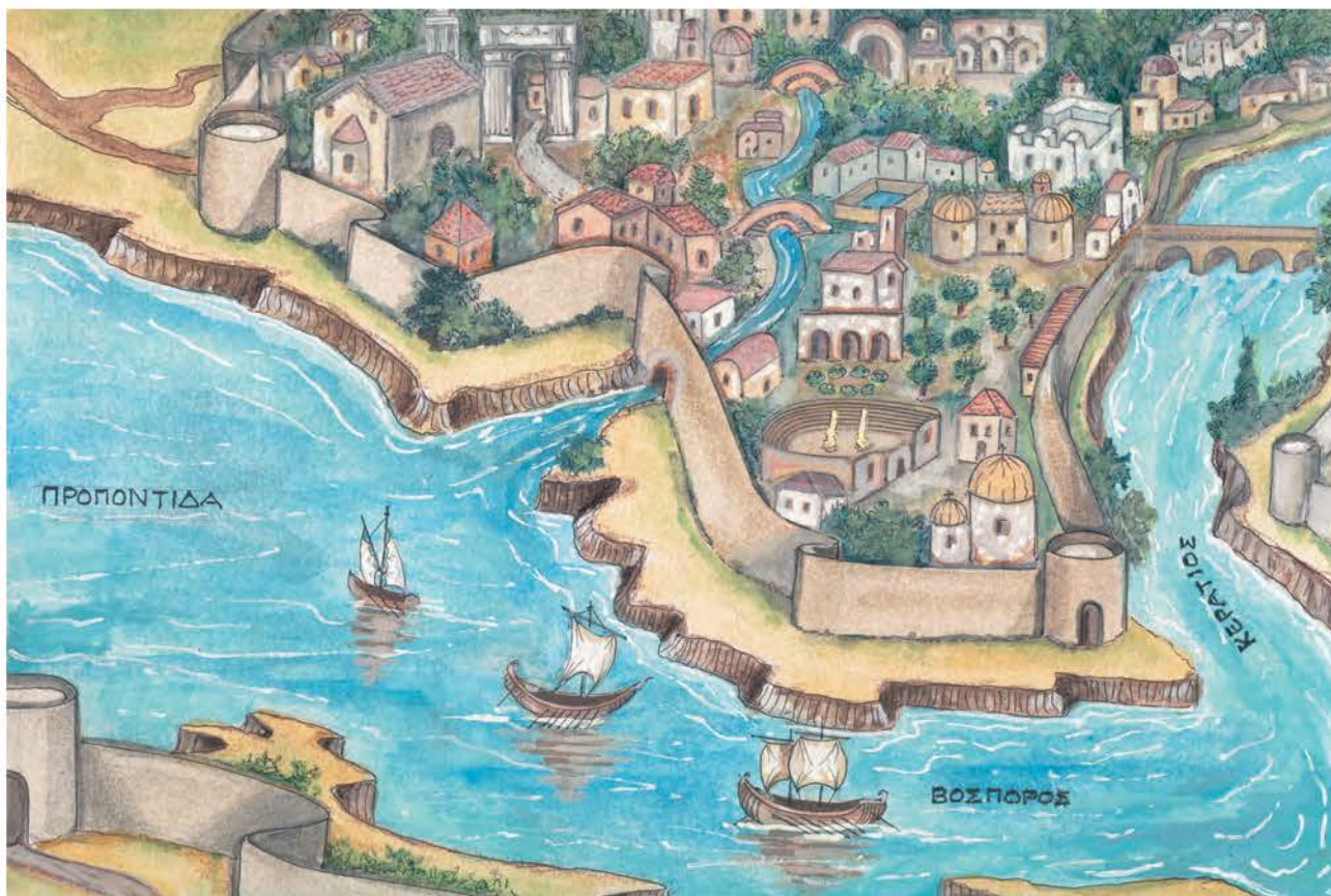
4. Η Κωνσταντινούπολη χτίστηκε σε επτά σχηρωμένους από τη στεριά λόφους, οι οποίοι «κατέβαιναν» ομαλά ως τη θάλασσα της Προποντίδας, του Βοσπόρου και του Κεράτιου κόλπου.