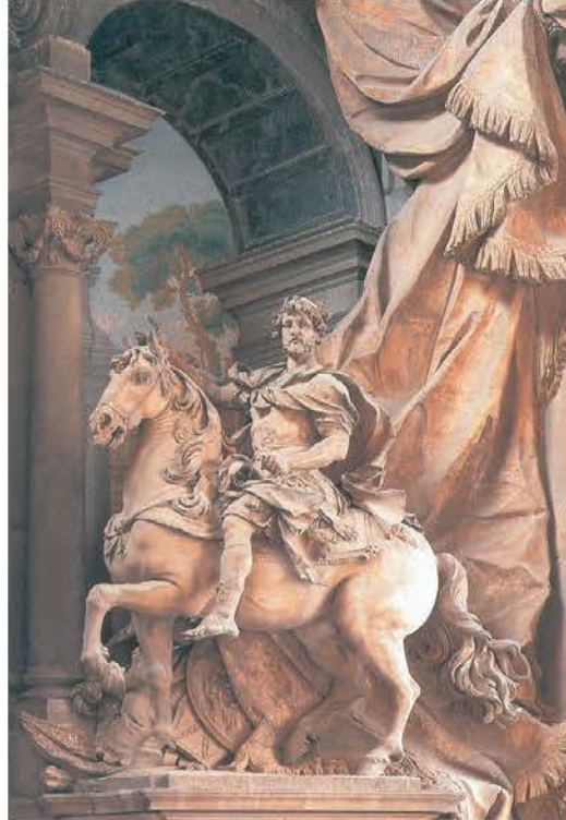
2. Ο αυτοκράτορας Κωνσταντίνος μετέφερε την πρωτεύουσα της αυτοκρατορίας από τη Ρώμη στο Βυζάντιο. (Μουσείο Βατικανού, 1600 μ.Χ. περίπου)