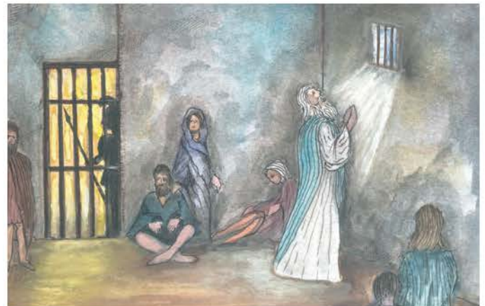
1. Πολλοί χριστιανοί διώχτηκαν και φυλακίστηκαν για την πίστη τους.