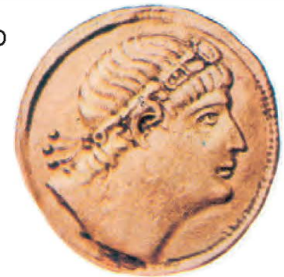
3. Ο Κωνσταντίνος σε νόμισμα της εποχής.

■ Το διάταγμα της ανεξιθρησκίας εξακολουθεί να είναι επίκαιρο και στην εποχή μας;