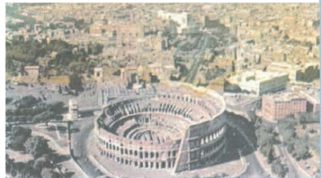
5.2. Το Κολοσσαίο της Ρώμης, όπως είναι σήμερα.