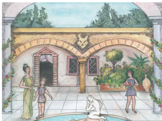
2. Έπαυλη πλουσίων στα προάστια.