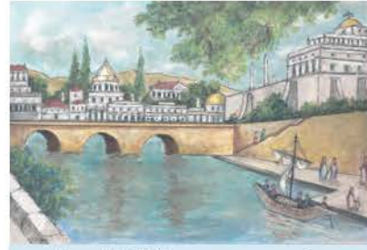
4.α. Ο Τίβερης ποταμός.

Η Ρώμη δεν είναι παραθαλάσσια. Ο Τίβερης ποταμός όμως, που ήταν πλωτός, συνέδεε την πόλη με τη θάλασσα και με όλα τα λιμάνια της Μεσογείου. Καθημερινά ανέβαιναν τον Τίβερη 25 φορτηγίδες 1 , μεταφέροντας σιτάρι στη Ρώμη και κοντά τους άλλες, φορτωμένες λάδι, κρασί, τρόφιμα, μέταλλα, υλικά οικοδομής και άλλα είδη για την αγορά. Οι Ρωμαίοι, εκτιμώντας την αξία του Τίβερη για τη ζωή τους, τον τιμούσαν και τον λάτρευαν ως θεό.