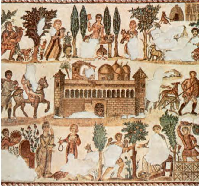
3. Ψηφιδωτή παράσταση ρωμαϊκού αγροκτήματος. (Τύνιδα, Εθνικό Μουσείο)