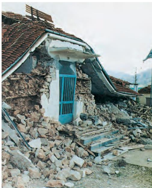
Εικόνα 27.1α: Καταστροφή από σεισμό