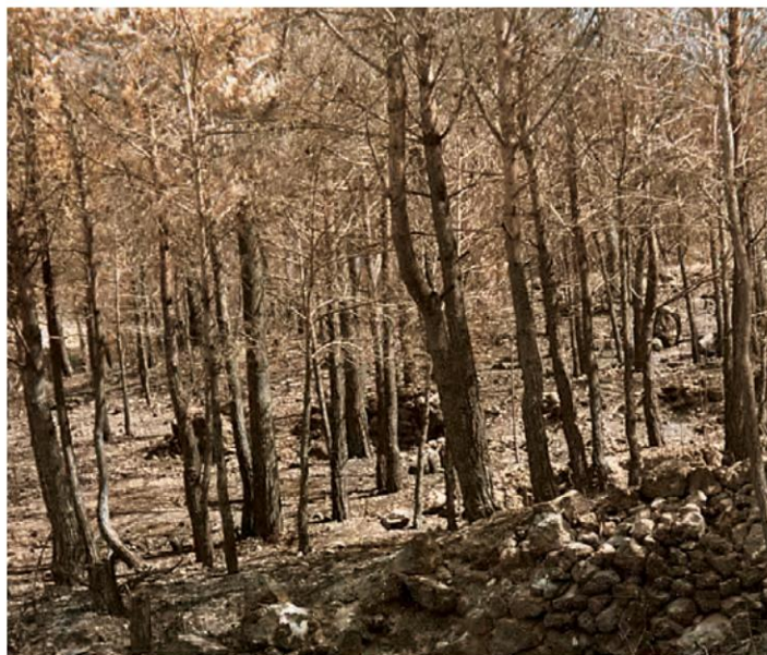
Εικόνα 27.1β: Καμένο δάσος

Παρατηρήστε τις καταστροφές στις εικόνες. Για ποιες από αυτές νομίζετε ότι φταίει ο άνθρωπος;