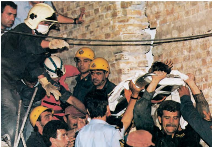
Εικόνα 27.3: Άνδρες της Ειδικής Μονάδας Αντιμετώπισης Καταστροφών (Ε.Μ.Α.Κ.) στο δύσκολο έργο τους

Το κράτος έχει δημιουργήσει υπηρεσίες για την παροχή βοήθειας στους ανθρώπους που πλήττονται από τις φυσικές καταστροφές. Αυτό όμως δεν αρκεί. Πρέπει όλοι να βοηθάμε κάθε συνάνθρωπό μας, όταν μας χρειάζεται. Στην περίπτωση ενός καταστρεπτικού σεισμού, για παράδειγμα, οι άστεγοι άνθρωποι χρειάζονται, εκτός από στέγη, είδη διατροφής και ένδυσης, φάρμακα και χρήματα και βέβαια την αγάπη μας και τη συμπαράστασή μας.