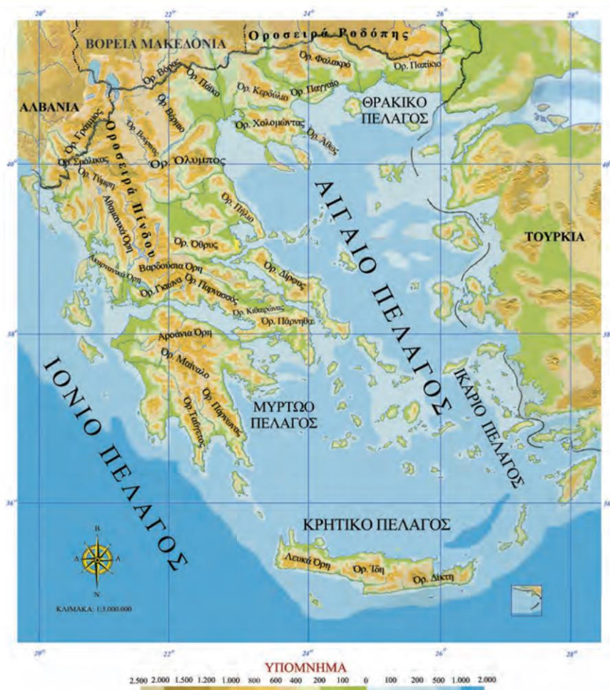
Εικόνα 13.2: Γεωμορφολογικός χάρτης της Ελλάδας

Όλα τα βουνά μαζί, μικρά και μεγάλα, αποτελούν ένα μεγάλο μέρος του κατακόρυφου διαμελισμού της χώρας μας. Αρκετά από αυτά έχουν άγριες κι απότομες πλαγιές, βαθιά φαράγγια και κοιλάδες που σχηματίζονται ανάμεσά τους και είναι τοπία στα οποία πολύ δύσκολα πλησιάζει ο άνθρωπος. Τα περισσότερα βουνά έχουν κατεύθυνση από τα βορειοδυτικά προς τα νοτιοανατολικά.