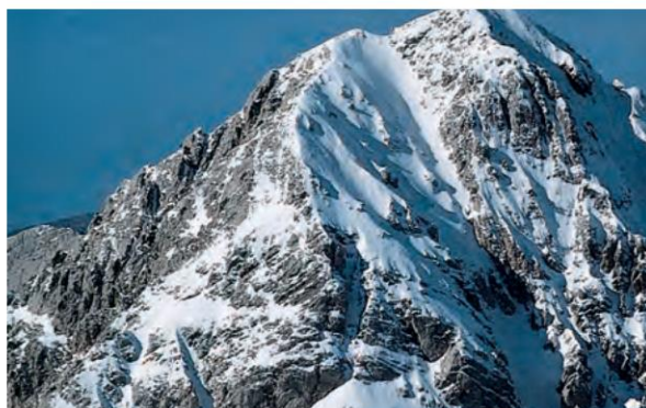
Εικόνα 13.1β: Ταΰγετος