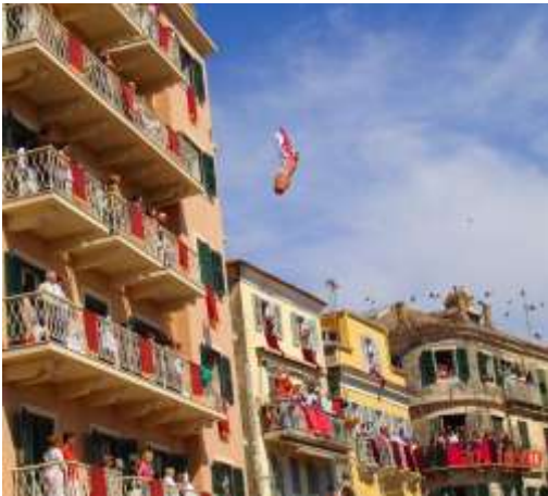
Μεγάλο Σάββατο στην Κέρκυρα

παλιά οι Κερκυραίοι πραγματοποιούν την περιφορά μαζί με το Σεπτό Σκήνωμα του Αγίου. Είναι η παλαιότερη κατανυκτική λιτανεία που βγαίνει σε ανάμνηση του θαύματος του Αγίου, που έσωσε τον κερκυραϊκό λαό από τη σιτοδεία. Το πρωί του Μεγάλου Σαββάτου