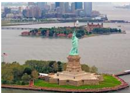
Νέα Υόρκη, Αγαλμα της Ελευθερίας και Νησί Έλλης

Σχεδόν 17 εκατομμύρια άνθρωποι πέρασαν τις πύλες