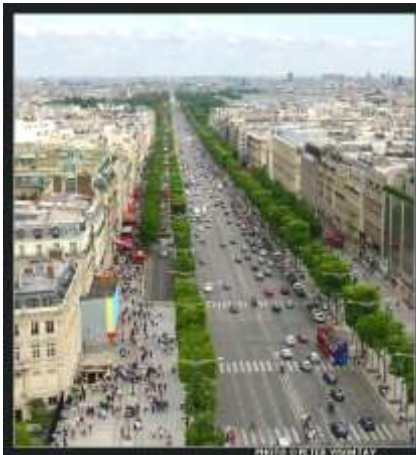
Παρίσι, Η Λεωφόρος Champs Elysses

τερο κάποιος ανακαλύπτει την πόλη αυτή, σίγουρα θα την λατρεύει.