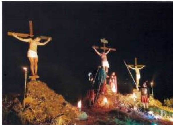
Αναπαράσταση της Σταύρωσης στη Μάρπησσα

Στην Ερμούπολη ο Επιτάφιος των Καθολικών ξεκινάει από τον Ιερό Ναό Ευαγγελιστών, ενώ οι Επιτάφιοι των Ορθόδοξων από τις ενορίες Αγίου Νικόλαου, της Κοιμήσεως και την Μητρόπολη της Μεταμορφώσεως. Κατά την περιφορά τους συναντιούνται στην κεντρική πλατεία Μιαούλη, όπου γίνεται κατανοκτική δέηση. Η περιφορά του Επιταφίου στη Μάρπησσα της Πάρου της είναι ενδιαφέρον γιατί κατά τη διάρκειά της γίνονται δεκαπέντε στάσεις περίπου. Σε κάθε στάση φωτίζεται και ένα σημείο του βουνού, όπου τα παιδιά ντυμένα Ρωμαίοι στρατιώτες ή μαθητές