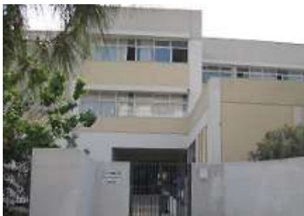
3ο Γυμνάσιο Παλαιού Φαλήρου

Ξεκινά μια καινούρια περίοδος. Πάλι θα είμαστε οι μικρότεροι, «τα πρωτάκια», σε ένα