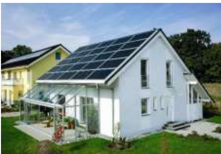
Σπίτι με φωτοβολταϊκά στοιχεία

Ένας τρόπος εξοικονόμησης ενέργειας Τον τελευταίο καιρό όλο και περισσότερο ακούμε για την ανάγκη εξοικονόμησης ενέργειας, για ένα καθαρότερο περιβάλλον και για πρωτο-