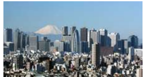
Το Τόκιο και στο βάθος το ηφαίστειο Φούτζι