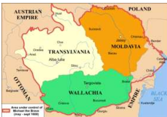
Χάρτης της Μολδοβλαχίας

Οι παραδουνάβιες αυτές χώρες αποτελούσαν για τους Έλληνες τόπους οικείους, στους οποίους μετανάστευαν και ζούσαν εκεί είτε μόλις είτε για κάποιο χρονικό διάστημα. Έλληνες που πήγαν κι εγκαταστάθηκαν στη Μολδοβλαχία ήταν κυρίως λόγιοι, κληρικοί, έμποροι αλλά και αγρότες που νοίκιαζαν τα κτήματα των τοπικών μεγαλοκτηματιών (Βογιάρων).