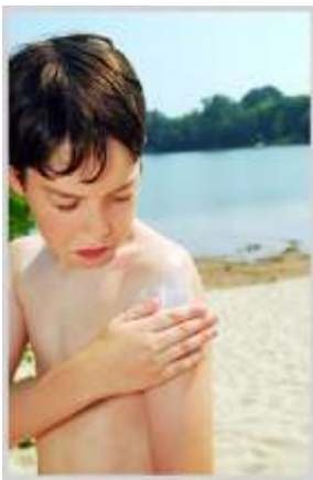
Δεν ξεχνάμε το αντηλιακό

Ο ήλιος πολλές φορές μας δημιουργεί εγκαύματα, κυρίως όταν βρισκόμαστε στην παραλία. Για να προφυλαχτούμε από τον ήλιο, θα πρέπει οπωσδήποτε να βάζουμε αντηλιακή κρέμα σε όλο το σώμα και κυρίως στην πλάτη,