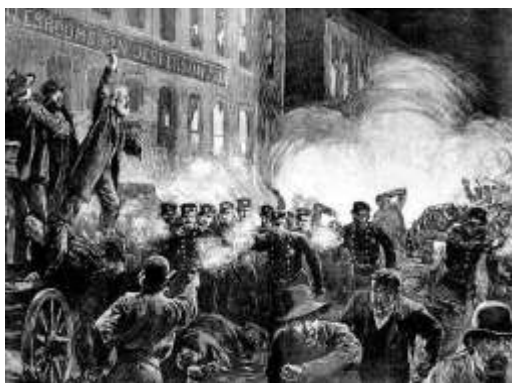
Γκραβούρα από την εξέγερση των εργατών στο Σικάγο (1886)

Εκείνη τη μέρα, 1η Μαΐου του 1886, 400.000 άνθρωποι συμμετείχαν στις απεργίες που γίνονταν στις Η.Π.Α, και πάνω από 80.000 στο Σικάγο. Αυτό το Σάββατο του 1886, μια εργάσιμη μέρα, οι εργάτες, ξεκίνησαν με τις γυναίκες και τα παιδιά τους για να διαδηλώσουν ειρηνικά στο χώρο της συγκέντρωσης στην πλατεία Haymarket.