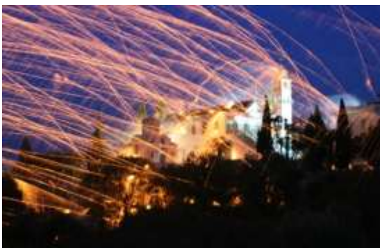
Ρουκετοπόλεμος στο Βροντάδο της Χίου

Η προετοιμασία ξεκινάει την επομένη του Πάσχα, ώστε να είναι έτοιμοι το Πάσχα της επόμενης χρονιάς. Στην Ανάσταση η κάθε ενορία πετάει προς την απέναντι εκκλησία τις ρουκέτες της. Επειδή υπήρχαν πολλά ατυχήματα, τα τελευταία χρόνια λήφθηκαν μέτρα, ώστε να προστατεύονται οι παρευρισκόμενοι και να διατηρηθεί το έθιμο.