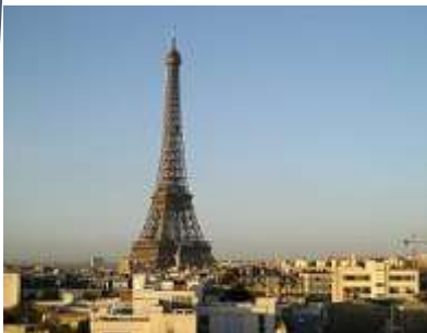
Παρίσι, Ο πύργος του Άιφελ

Η Γαλλία είναι μια πανέμορφη χώρα με πρωτεύουσα το Παρίσι. Για να φτάσει κάποιος στο Παρίσι μπορεί να πάρει το αεροπλάνο, που είναι το πιο γρήγορο μέσο, το τρένο και το αυτοκίνητο. Το Παρίσι αλλιώς ονομάζεται πόλη του φωτός και η ιστορία του, είναι μία από τις μεγαλύτερες σ' όλο τον κόσμο.