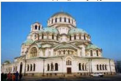
Σόφια, Καθεδρικός Αλεξάντερ Νέβσκι

Πάρα πολλά κτίσματα και μνημεία στη Σόφια θα διεκδικήσουν τον τίτλο του εμβλήματος της