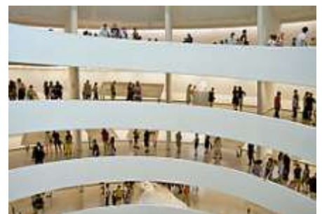
Νέα Υόρκη, Μουσείο Γκούγκενχάιμ

Το μουσείο αυτό όχι απλά φιλοξενεί μία από τις ωραιότερες συλλογές τέχνης, αλλά το ίδιο το κτίριο στο οποίο στεγάζεται αποτελεί ένα αριστούργημα αρχιτεκτονικής. Σχεδιάστηκε από τον αρχιτέκτονα Ράιτ και μοιάζει με ένα γιγαντιαίο λευκό όστρακο. Κάποια από τα διασημότερα έργα τέχνης που φιλοξενεί είναι: