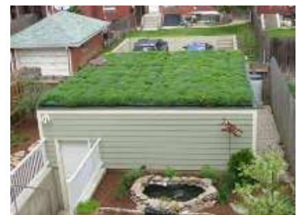
Σπίτι με πράσινη ταράτσα

οι επιβλαβείς ουσίες από τον αέρα, ενώ οι ένοικοι, αν κάθονται στη φυτεμένη ταράτσα, βρίσκονται σε ένα περιβάλλον πλουσιότερο