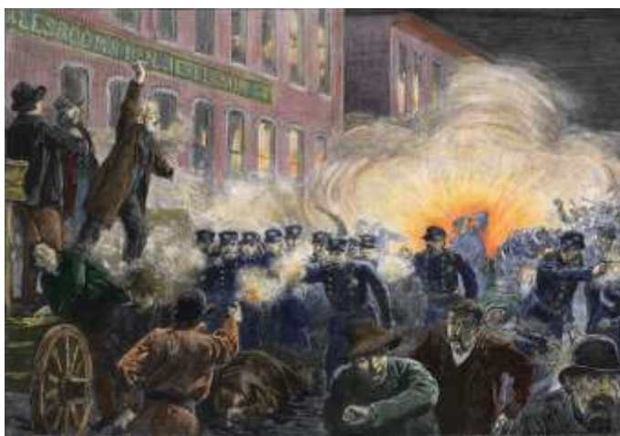
Από τα γεγονότα του Σικάγου (1886)

Το 1886, στο Σικάγο, όταν ήταν πρώτη Μαΐου οι εργάτες σταδιακά άρχισαν να κάνουν πολλές διαδηλώσεις και να διαμαρτύρονται πώς έχουν κουραστεί να δουλεύουν όλη την ημέρα και για αυτό θέλανε κάθε μέρα να δουλεύουν μόνο 8 ώρες. Κι ενώ το πλήθος παρακολουθούσε τις ομιλίες, κάποιον εργατών, ο