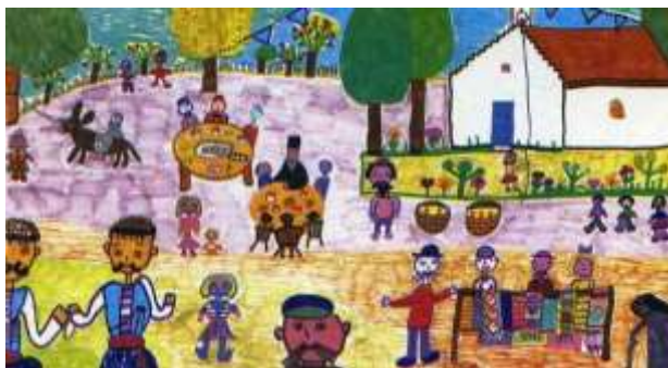
Παιδική ζωγραφιά για το Πάσχα (Μουσείο Παιδικής Τέχνης)

Η λέξη Πάσχα προέρχεται από την εβραϊκή λέξη Πεσσάχ που σημαίνει πέρασμα.