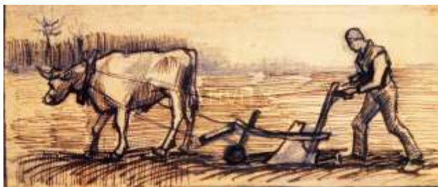
Βαν Γκογκ : Στο αλέτρι

Το όργανο γινόταν τα παλιά χρόνια με το ξύλινο αλέτρι. Είχε μήκος δυόμισι περίπου μέτρα, αρκετά μεγαλύτερο δηλαδή από το σιδεράλετρο, και όλος ο εξοπλισμός του ήταν ξύλινος εκτός από το