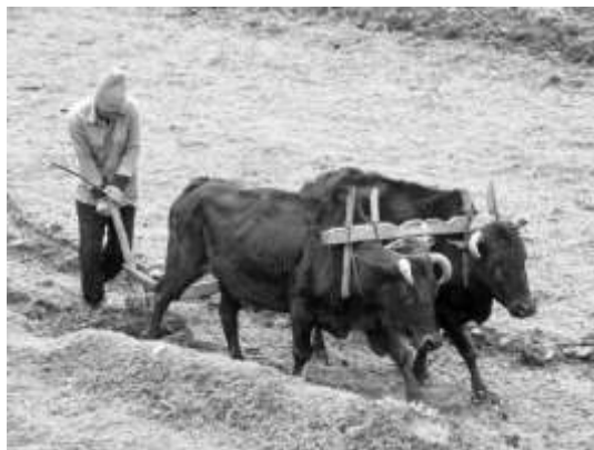
Όργωμα με τα βόδια να τραβούν το αλέτρι

δουλεύουν όλη μέρα, ολόκληρο τον χρόνο, εκκερσώνοντας συχνά, παράνομα ή νόμιμα και προσπαθώντας μ' αυτόν τον τρόπο