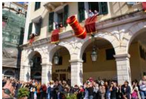
Μπότηδες στην Κέρκυρα

Εντυπωσιακό και θορυβώδες, το Πάσχα στην Κέρκυρα φέρνει στο νου όλων το περίφημο έθιμο με τους μπότηδες που λαμβάνει χώρα το Μεγάλο Σάββατο στην καρδιά της όμορφης πόλης. Η φύση είναι ντυμένη στα πράσινα, με τις ευωδιές των λουλουδιών, και η πόλη να ετοιμάζε-