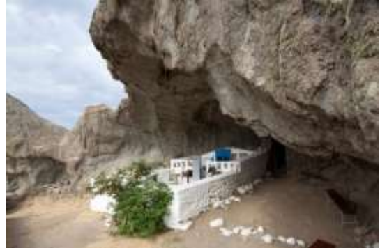
Η Παναγιά Κακαβιώτισσα στη Λήμνο

Μ.Δευτέρα: Καθάρριζαν και συγύριζαν τα σπίτια. Έστρωναν τα γιορ-