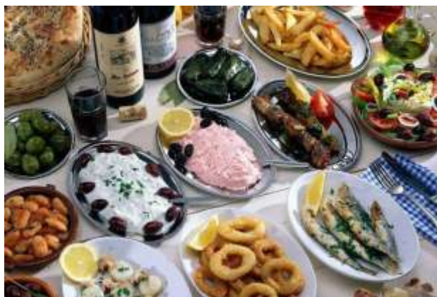
Το σαρακοσιανό τραπέζι