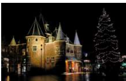
Χριστούγεννα στην Ολλανδία

Στην Ολλανδία η περίοδος των Χριστουγέννων ξεκινάει με μια παράδοση η οποία αρχικά δεν είχε καμία σχέση με τα Χριστούγεννα. Σύμφωνα με το θρύλο που ανάγεται στην εποχή που η Ολλανδία ήταν αποικιοκρατική και τα χριστουγεννιάτικα προϊόντα έρχονταν από τις αποικίες της, ο Άγιος Νικόλαος, ο οποίος ονομάζεται «SinterKlaas» φθάνει στην Ολλαν-