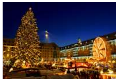
Χριστούγεννα στη Γερμανία

Στη Γερμανία είναι το διάστημα που προηγείται των Χριστουγέννων. Παραδοσιακά έθιμα της περιόδου είναι η παρασκευή των χριστουγεννιάτικων μπισκότων και του χριστουγεννιάτικου κέικ. Επίσης χαρακτηριστικές είναι οι χριστουγεννιάτικες αγορές που εμφανίζονται στο κέντρο κάθε πόλης από το πρώτο Σαββατοκύριακο του Δεκεμβρίου μέχρι και την παραμονή των Χριστουγέννων. Οι μπάγκοι της Χριστουγεννιάτικης αγοράς έχουν γλυ-