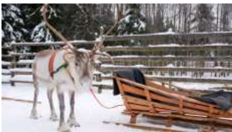
Τάρανδος στη Φινλανδία

Στη Φινλανδία η 24η Δεκεμβρίου είναι η σημαντικότερη ημέρα της περιόδου των Χριστουγέννων. Οι εορτασμοί αρχίζουν το μεσημέρι, οπότε σύμφωνα με τη μεσαιωνική