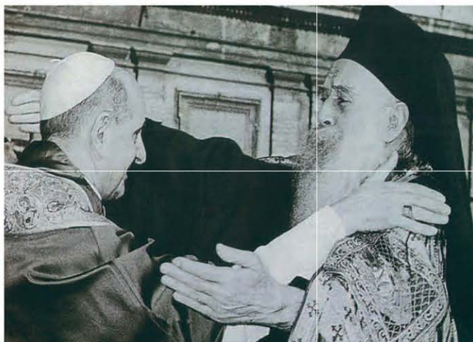
Η συνάντηση του Οικουμενικού Πατριάρχη Αθηναγόρα με τον Πάπα Παύλο Στ΄ στο Βατικανό το 1967, Αρχείο Ν. Μαγγίνα.

Οι Ιουδαίοι θέλουν θαύματα, οι δε Έλληνες ζητούν σοφία, εμείς όμως κηρύττουμε Χριστό σταυρωμένο, ο οποίος, για μεν τους Ιουδαίους είναι σκάνδαλο, για δε τους Έλληνες ανοησία, αλλά για εκείνους που είναι καλεσμένοι, Ιουδαίους και Έλληνες, ο Χριστός που κηρύττουμε είναι Θεού δύναμη και Θεού σοφία.