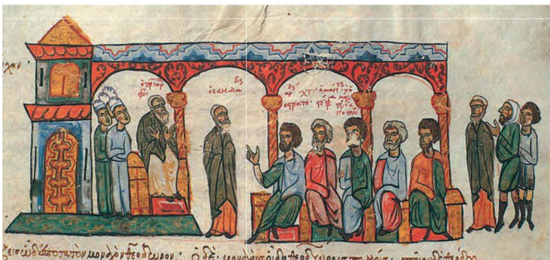
Μικρογραφία από τον εικονογραφημένο κώδικα της Χρονογραφίας του Ι. Σκυλίτζη (12ος-14ος αι. μ.Χ.). Μεταξύ άλλων εικονίζεται ο Πατριάρχης Φώτιος καθισμένος σε θρόνο.

Στα χρόνια που ακολούθησαν, η ενότητα της Εκκλησίας δοκιμάστηκε σκληρά από νέες διαμάχες. Όταν ήταν Πατριάρχης Κωνσταντινουπόλεως ο Φώτιος (858-867 και 877-886 μ.Χ.) και Πάπας Ρώμης ο Νικόλαος Α΄, συνέβη η πρώτη μεγάλη ρήξη μεταξύ των Εκκλησιών της Ρώμης και της Κωνσταντινούπολης. Ο κυριότερος λόγος ήταν δογματικός, δηλαδή, η προσθήκη από τους Ρωμαιοκαθολικούς στο Σύμβολο της Πίστεως της φράσης «καί ἐκ τοῦ Υἱοῦ», όταν γίνεται αναφορά στην εκπόρευση του Αγίου Πνεύματος*.