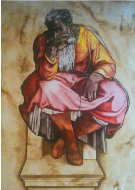
Ο προφήτης Ιερεμίας

Ο Ιερεμίας είχε τη βαθιά πεποίθηση ότι ο άνθρωπος μπορεί να αλλάξει στ' αλήθεια, μόνο όταν μετανιώσει πραγματικά. Μια τέτοια μετάνοια όμως δεν πετυχαίνεται με εξωτερικές αλλαγές. Είναι πάνω απ' όλα μια υπόθεση της καρδιάς, εσωτερική.