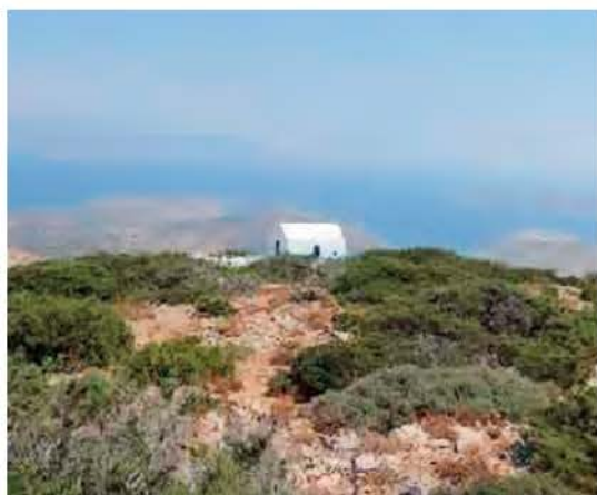
Εκκλησάκι του «Άι Λια» στο βουνό

Ο λόγος που οι εκκλησίες του προφήτη Ηλία είναι χτισμένες στο βουνό σχετίζεται με τη λαϊκή παράδοση η οποία αναφέρει ότι ο «Άι Λιας» ήταν ναύτης που η θάλασσα προσπάθησε πολλές φορές να τον πνίξει. Γι' αυτό, όταν βαρέθηκε τα ταξίδια, αποφάσισε να βρει ένα μέρος που να μην ξέρουν οι άνθρωποι εκεί τι είναι θάλασσα και καράβι. Έτσι, σύμφωνα με την παράδοση, πήρε ένα κουπί στον ώμο και τράβηξε για τη στεριά. Όποιον συναντούσε τον ρωτούσε τι είναι αυτό που κρατάει στα χέρια του και όσο του απαντούσαν «κουπί», τραβούσε ψηλότερα. Όταν κάποτε έφτασε σε ένα ψηλό βουνό, συνάντησε έναν τσοπάνη και τον ρώτησε τι ήταν αυτό που βαστούσε.