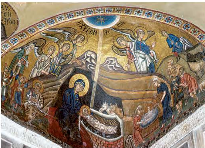
Η εικόνα της Γέννησης, ψηφιδωτό από τη Μονή Δαφνίου.

Στα χρόνια των Μακεδόνων χτίστηκαν σε όλη την αυτοκρατορία πολλές και ωραίες εκκλησίες με έναν νέο ρυθμό , που τον ονόμασαν Βυζαντινό . Το κτίσμα τους έχει σχήμα σταυρού και στο μέσον του στηρίζεται ο τρούλος. Οι αγιογραφίες και τα ψηφιδωτά τους έχουν τη φυσικότητα, τη χάρη και την αισιοδοξία της αρχαίας ελληνικής τέχνης.