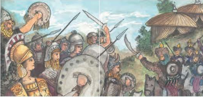
4. Ο ρωμαϊκός στρατός αντιμετώπισε αποτελεσματικά τις επιθέσεις των Ούννων.

Με την ίδια ευκολία οι Γότθοι κατέκτησαν τις δυτικές επαρχίες, της Γαλλίας, της Ισπανίας και της Ιταλίας. Στην τελευταία μάλιστα, ο αρχηγός των Οστρογόθων Θευδέριχος ίδρυσε το «γοθικό βασίλειο της Ιταλίας» με πρωτεύουσα τη Ραβέννα .