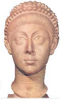
2. Αρκάδιος (Μουσείο Κωνσταντινούπολης)

Τα επόμενα χρόνια οι οργανωμένες γοθτικές φυλές επιτέθηκαν πάλι κατά των δυτικών επαρχιών. Το Δυτικό ρωμαϊκό κράτος, αδύναμο οικονομικά και στρατιωτικά, δεν μπόρεσε αυτή τη φορά να τους αντιμετωπίσει. Έτσι, μια απ' αυτές τις φυλές, οι Βάνδαλοι, με αρχηγό τους τον Γελίμερο , πέρασαν τον Ρήνο και μέσα από τη Γαλλία και την Ισπανία έφτασαν στο Γιβραλτάρ. Από εκεί, σχεδόν ανεμπόδιστοι, πέρασαν στη βόρεια Αφρική κατέλαβαν την Καρχηδόνα και την έκαναν πρωτεύουσά τους.