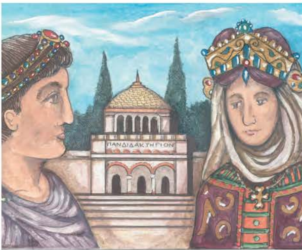
5.1. Η αυτοκράτειρα Ευδοκία έφερε την ελληνική Παιδεία από την Αθήνα στην Κωνσταντινούπολη.

«Στο Ανατολικό κράτος έγιναν σημαντικές εσωτερικές αλλαγές στη διάρκεια του 5ου αιώνα. Ο αυτοκράτορας Θεοδόσιος Β' και η Ελληνίδα σύζυγός του Ευδοκία ίδρυσαν στην Πόλη το Πανδιδακτήριο, ένα είδος Πανεπιστημίου της εποχής. Τα μαθήματα σ' αυτό διδάσκονταν στην ελληνική και τη λατινική γλώσσα. Από τους 31 καθηγητές του οι 16 δίδασκαν στην ελληνική και οι 15 στη λατινική γλώσσα.