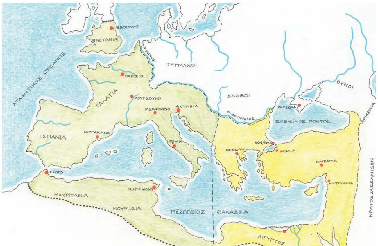
1. Χάρτης του Ανατολικού και του Δυτικού Ρωμαϊκού Κράτους, μετά τη διαίρεση της αυτοκρατορίας από τον Θεοδόσιο.

Η βυζαντινή αυτοκρατορία μένει ενωμένη έως τα τέλη του 4ου μ.Χ. αιώνα. Τα τελευταία χρόνια της βασιλείας του Θεοδόσιου όμως μετακινούμενοι λαοί – Ούννοι, Γότθοι και Βάνδαλοι – παραβιάζουν τα βόρεια σύνορα και απειλούν την αυτοκρατορία. Τότε ο Θεοδόσιος, λίγο πριν από τον θάνατό του (395 μ.Χ.), μοίρασε την αυτοκρατορία στους δυο γιους του, πιστεύοντας ότι έτσι θα κυβερνιόταν καλύτερα. Ο Αρκάδιος πήρε το ανατολικό της τμήμα και ο Ονώριος το δυτικό.